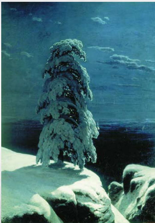
Иван Шишкин На севере диком

А. Пушкин называл искусство «магическим кристаллом» , сквозь грани которого по-новому видны окружающие нас люди, предметы и явления привычной жизни.