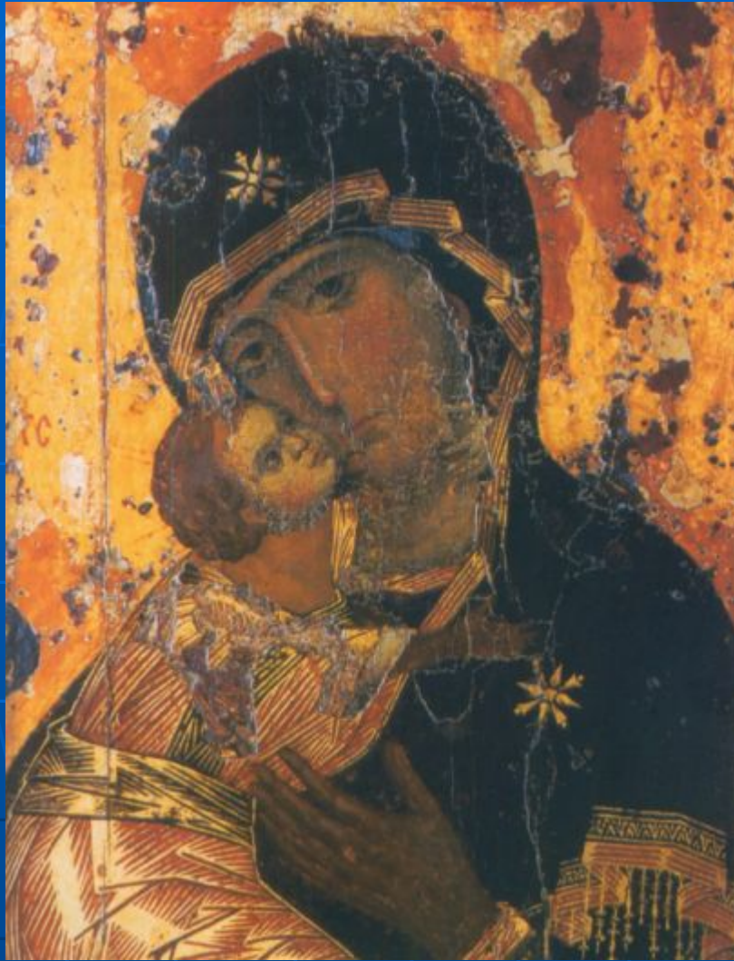
Икона Владимирской Божией Матери. Константинополь. XII в.