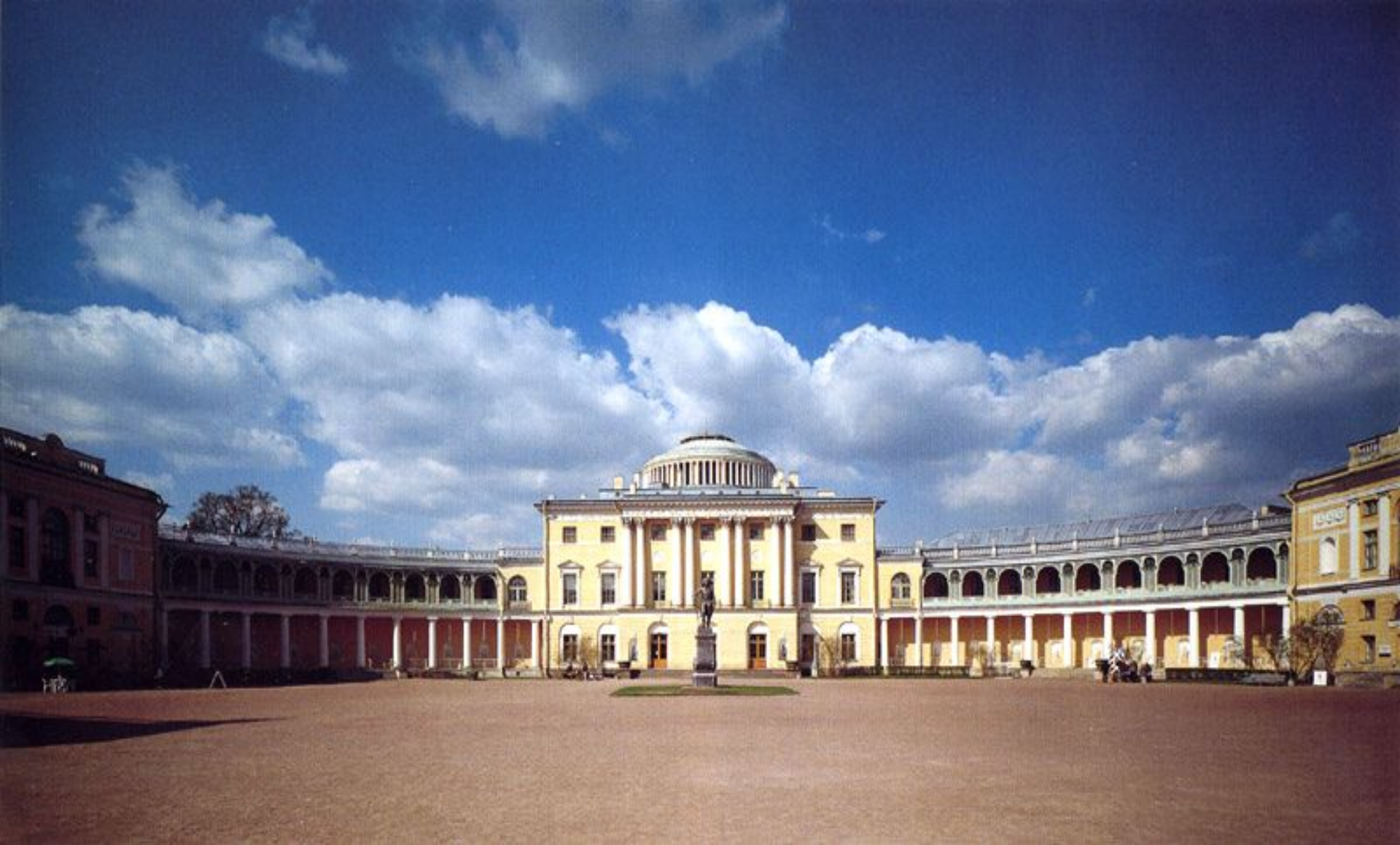
Дворец в Павловске Камерон Ч.