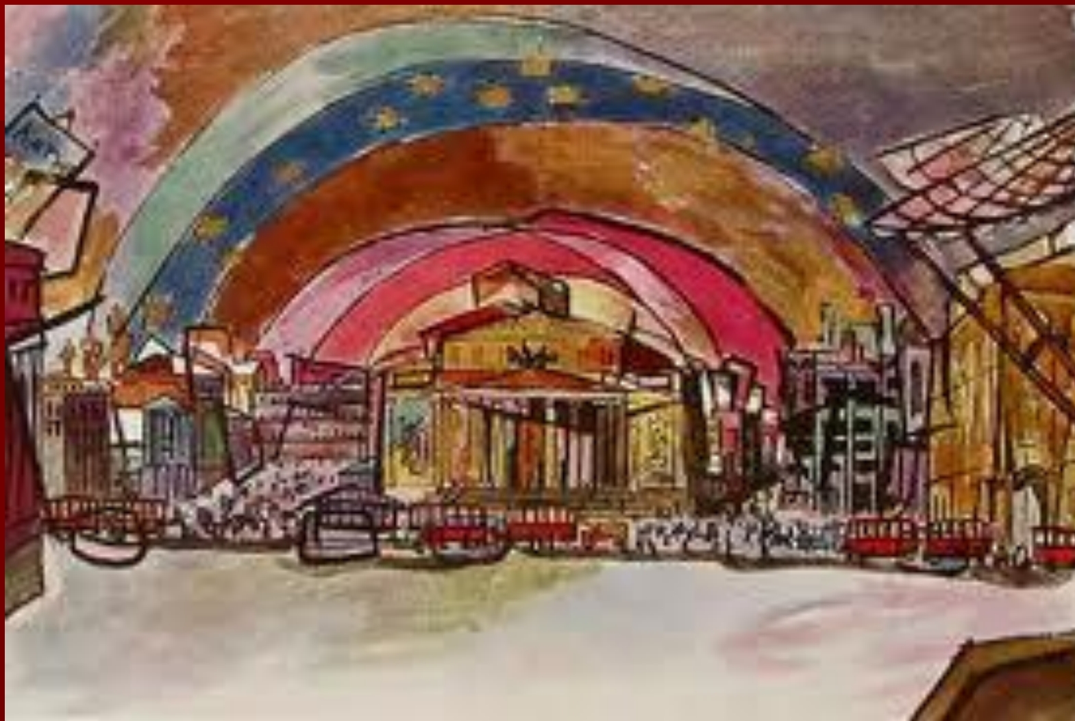
Эскиз декорации к трагедии В. Маяковского

Выступал также как театральный художник.