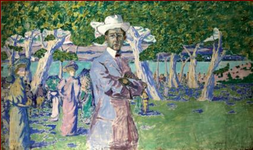
Портрет Н.А. Соловьева