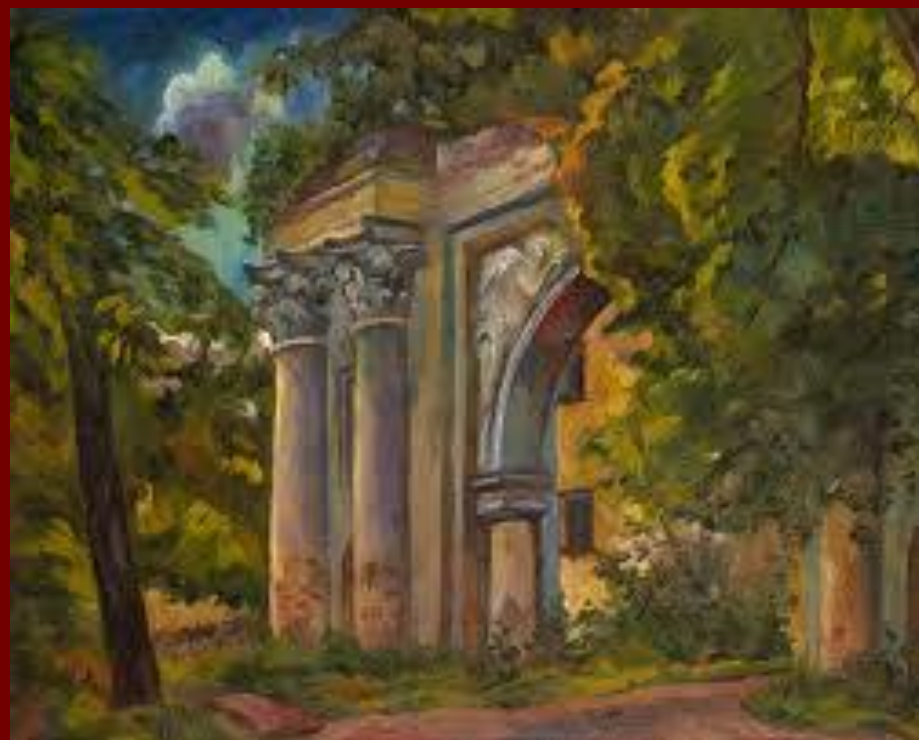
Архангельское. Старинные ворота.