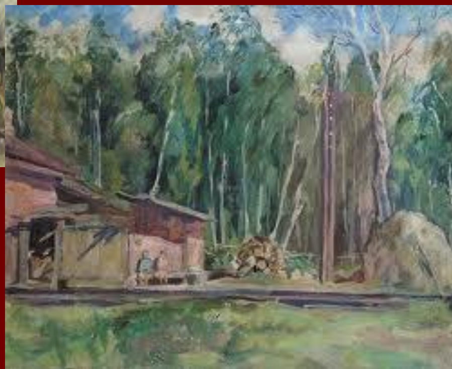
Пейзаж с железнодорожной будкой. 1940