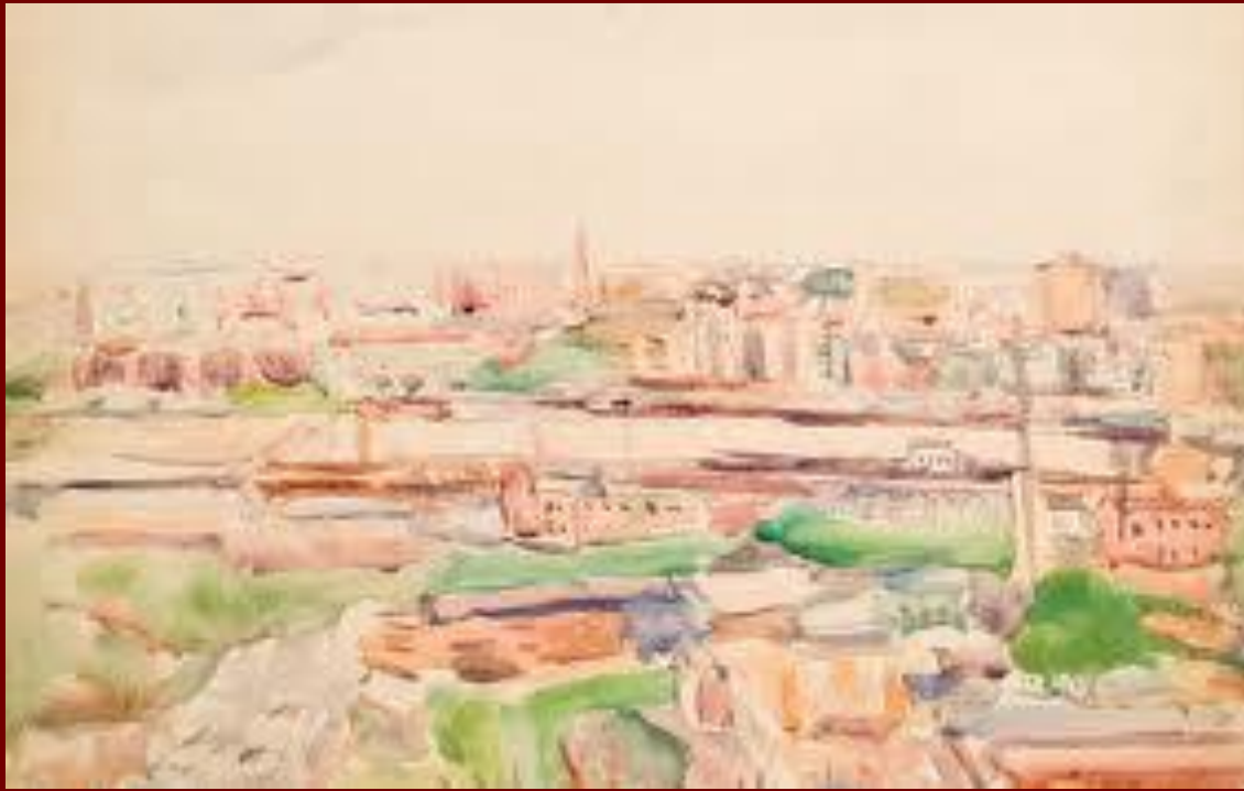
Эскиз города. Композиция №7. 1930-е Бумага, акварель.

В 1933 году состоялась единственная прижизненная персональная выставка Лентулова на которой, наряду с картинами, написанными в советское время были представлены все его знаменитые произведения середины 1910-х годов, выставлявшиеся на выставках "Бубнового валета".