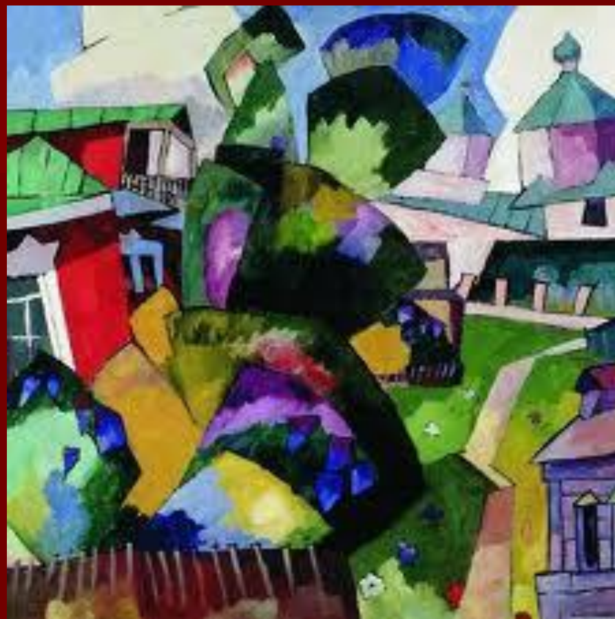
Деревянная церковь. 1918.