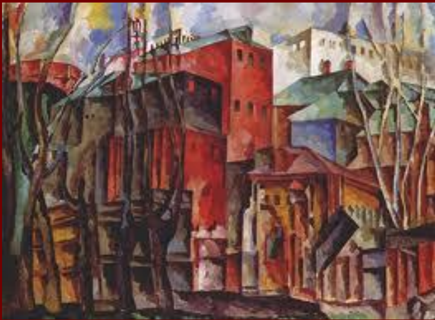
Пейзаж с сухими деревьями и высокими домами . 1920г.

Пронизанные ощущением полноты бытия, они ближе к натуре, жизненным прообразам.