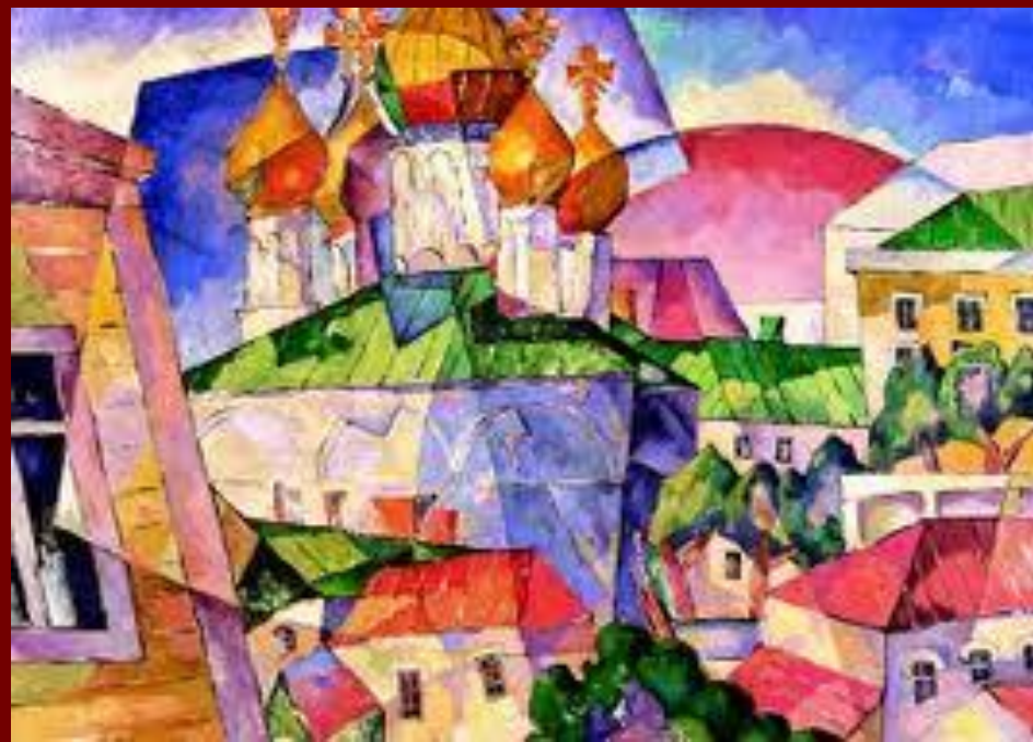
На Петровке .

■ Испытывая в 1910-е гг. воздействие кубизма, футуризма и орфизма, Лентулов, вместе с тем стремился придать своим образам отчётливый национальный характер, обращаясь к мотивам древнерусского зодчества, осмысляя традиции иконописи и лубка.