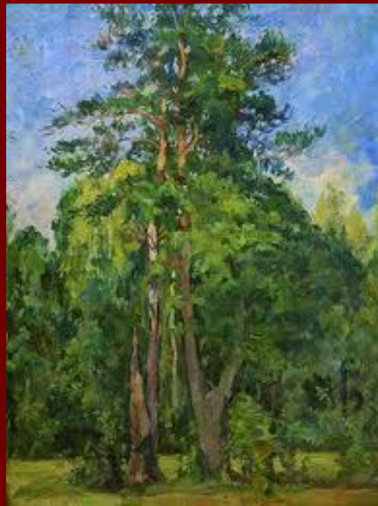
Деревья. Конец 30-х - Начало 40-х