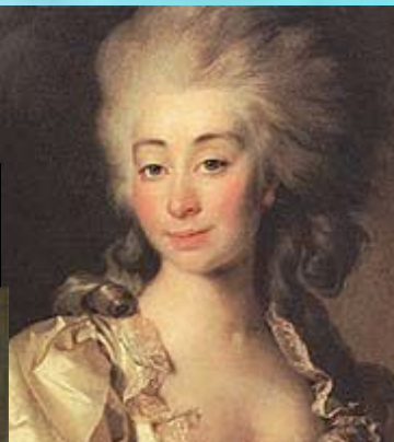
Портрет графини Урсулы Мнишек