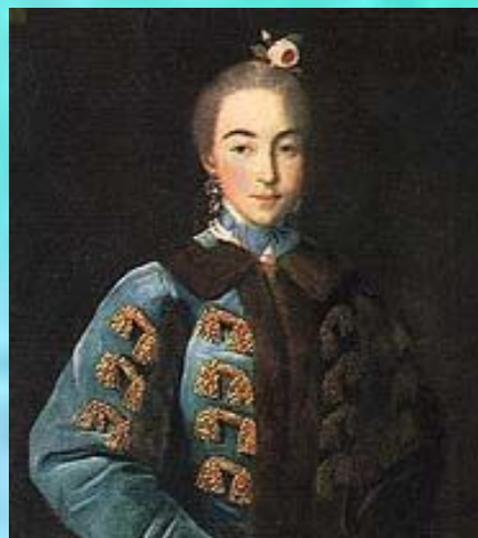
Портрет графини А.П.Шереметьевой