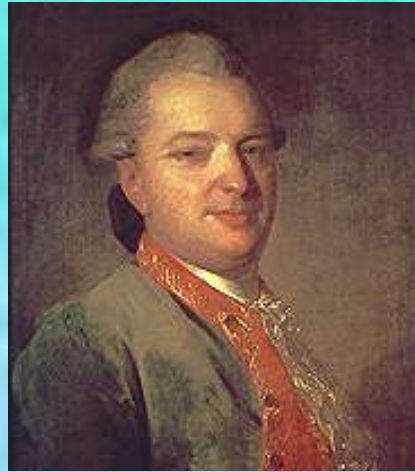
Портрет В.И. Майкова