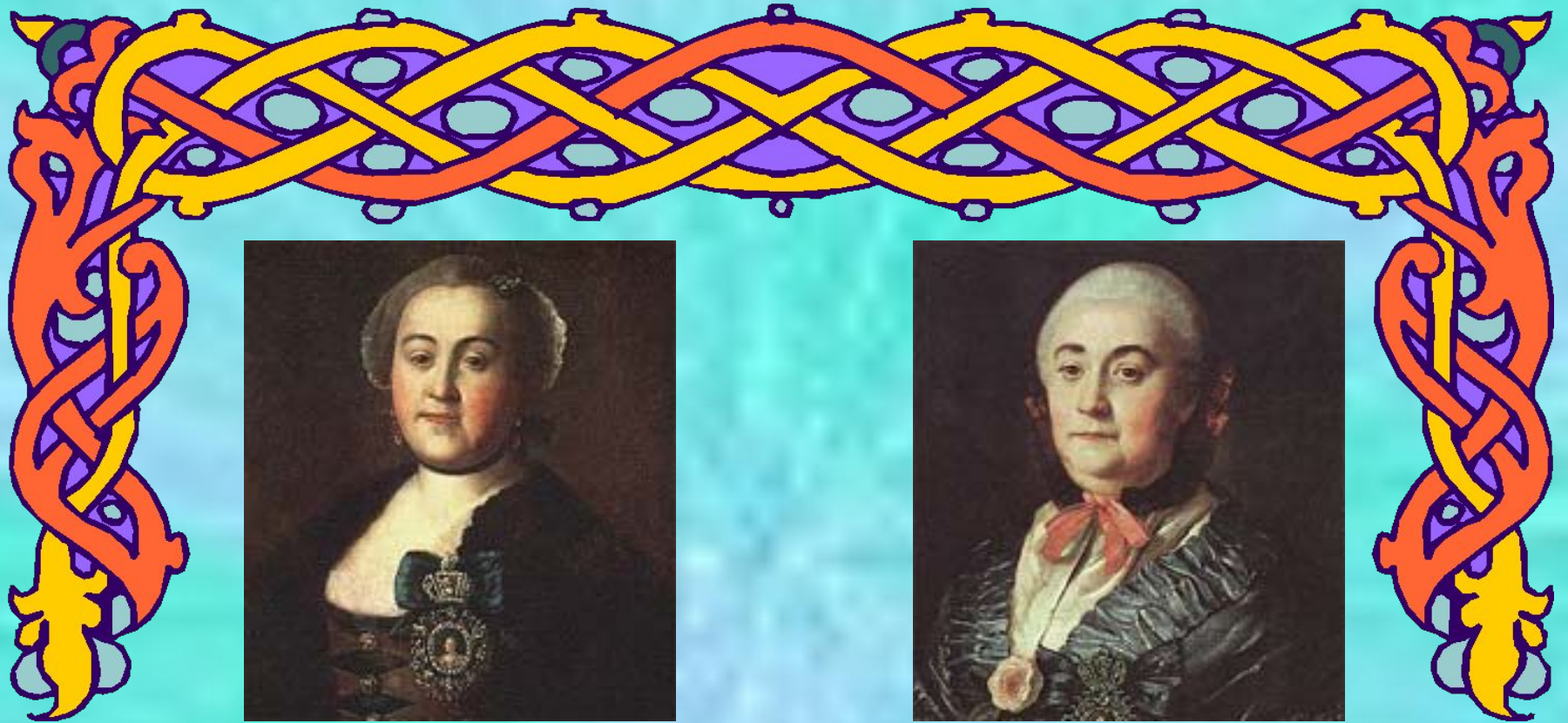
Портрет статс-дамы А.Л.Апраксиной