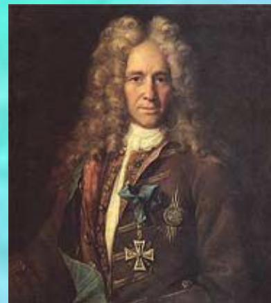
Портрет государственного канцлера графа Г.И.Головкина

НИКИТИН Иван Никитич (около 1690-1742)- русский живописец, один из основоположников русской светской живописи. В портретах добивался передачи характерных индивидуальных черт модели и материальности изображенных предметов («Царевна Анна Петровна», не позднее 1716; «Напольный гетман», 1720-е годы; «Петр I на смертном