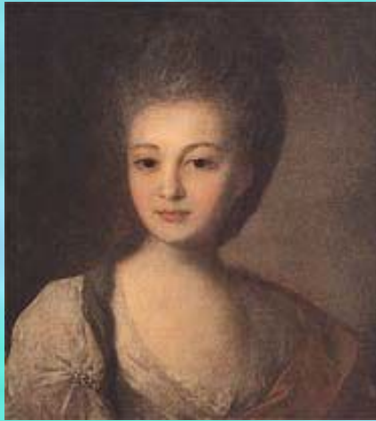
Портрет А.П. Струйской