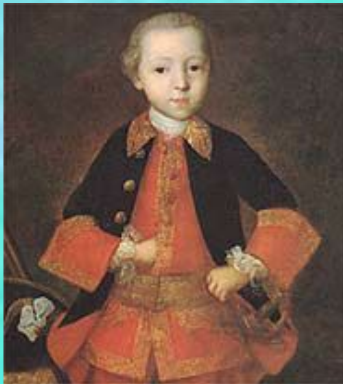
Портрет Князя Голицына

ВИШНЯКОВ Иван Яковлевич (1699-1761) -русский живописец. В портретах Вишнякова унаследованные от русской парсуны условность поз и плоскостность сочетаются с живой характеристикой модели и утонченным колоритом в духе рококо («Ф. Н. Голицын»,