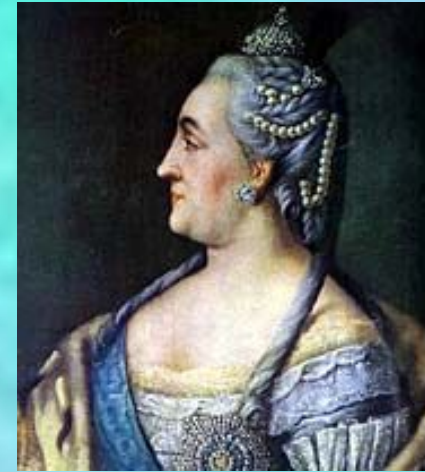
Портрет Екатерины Второй

РОКОТОВ Федор Степанович [1735(?) — 1808] - русский живописец.