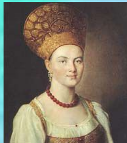
Портрет неизвестной крестьянки

Иван Петрович Аргунов вошел в историю прежде всего как видный мастер барочного портрета (с легкими элементами простодушного, как бы «провинциального» рококо). Его парадные композиции, сперва несколько жестковатые, а позднее все более мягкие и живописные по колориту («И. И. Лобанов-Ростовский» и «Е. А. Лобанова-Ростовская», 1750-1754 гг.; «П. Б. Шереметев» и «А. П. Шереметева», 1760-е гг.; посмертные портреты Б. П. и А. П. Шереметевых, 1768) достаточно эффектны, но не эпохальны.