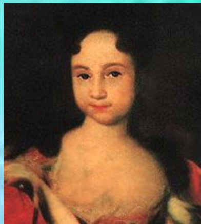
Царевна Анна Петровна