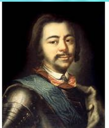
Портрет Петра Первого