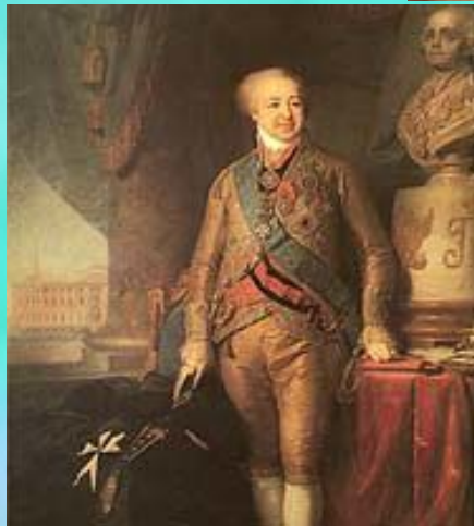
Портрет вице- канцлера князя А.Б. Куракина