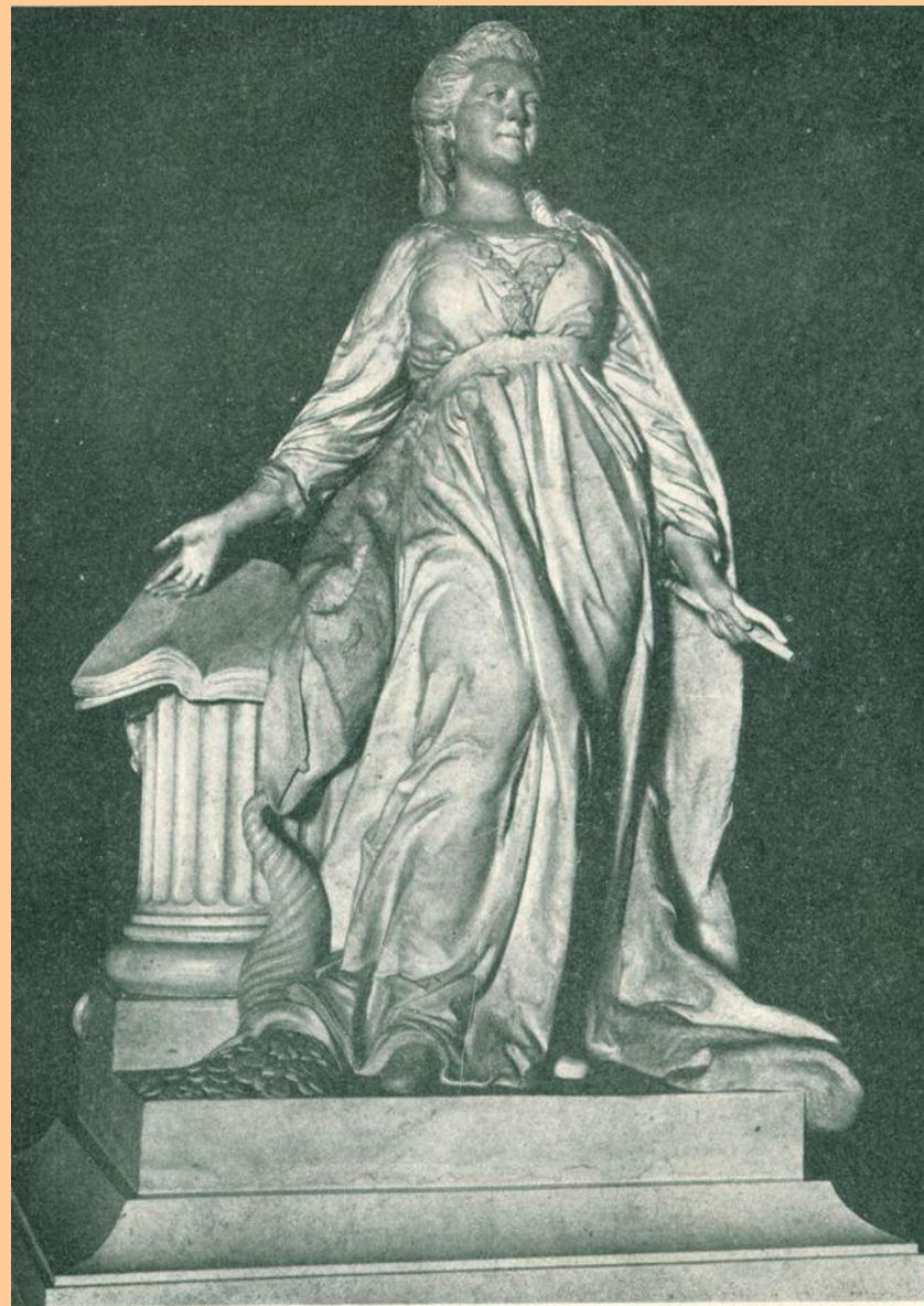
Екатерина II. Бюст.