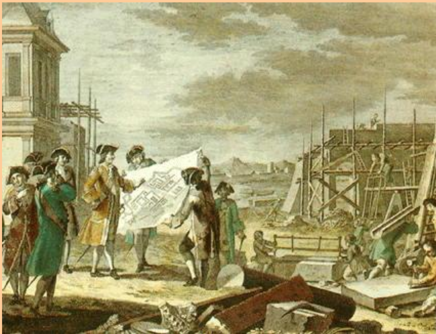
Основание Санкт –Петербурга. 1703 г.