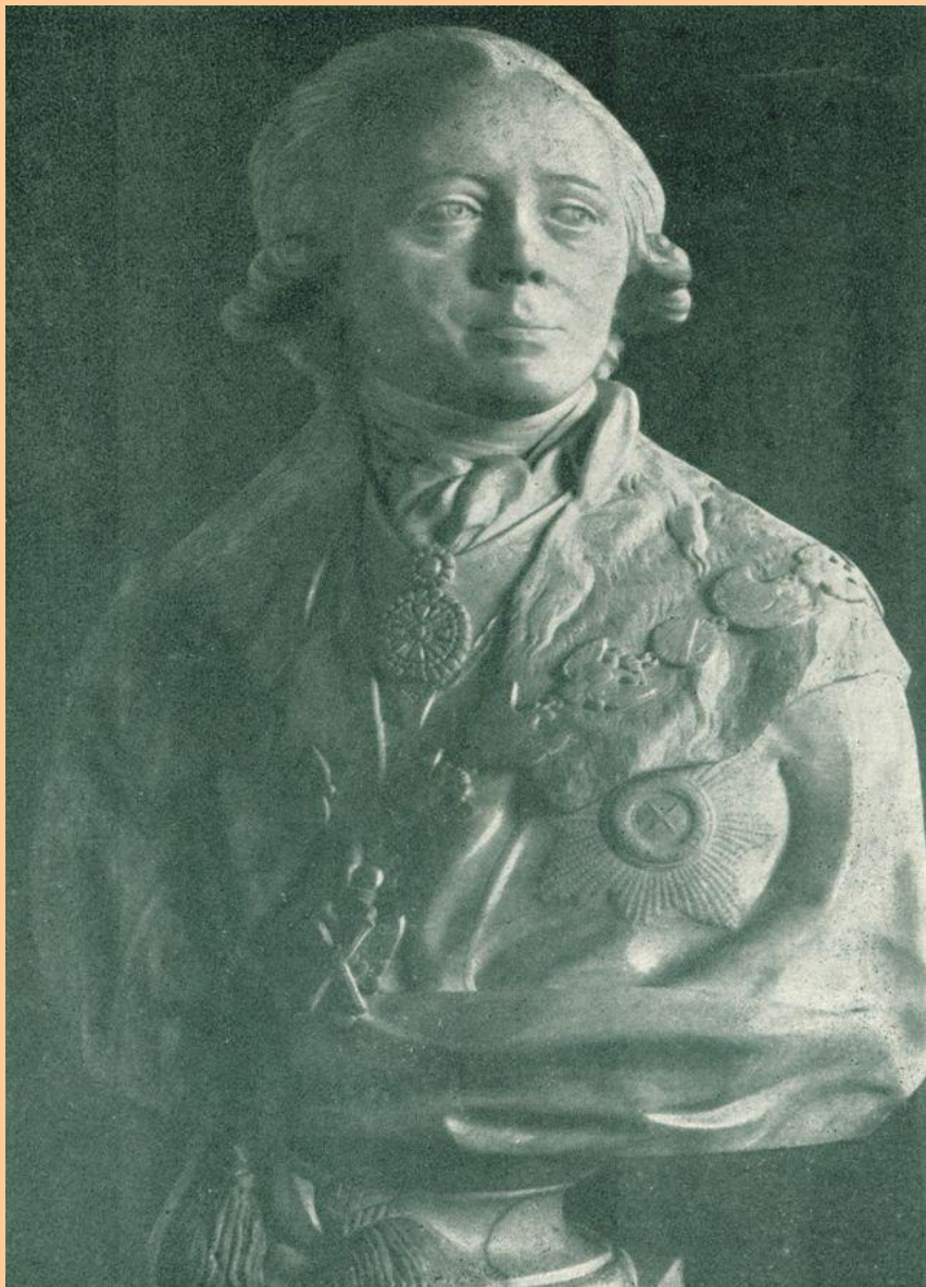
Павел I. Бюст.