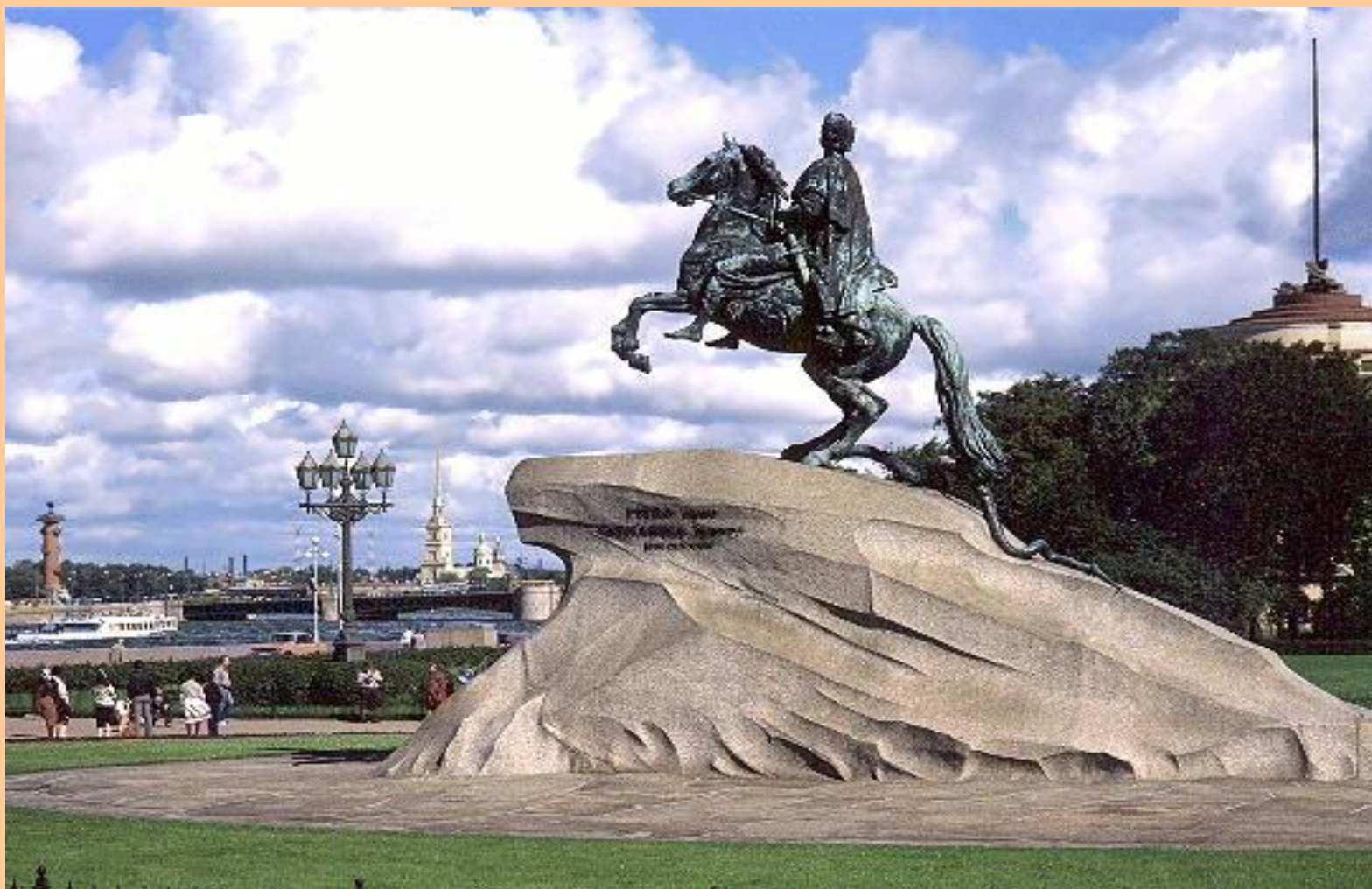
Э-М. Фальконе. Памятник Петру Первому. «Медный всадник».