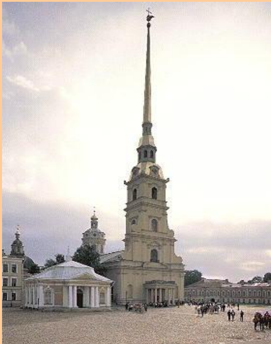
Петропавловский собор. Доменико Андреа Трезини