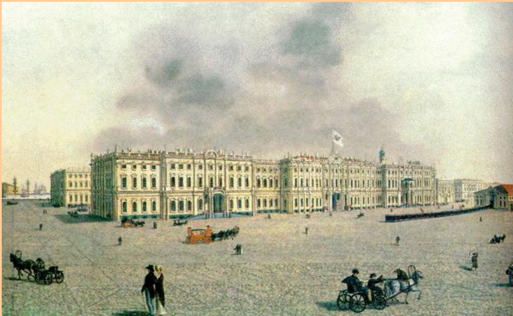
Варфоломей Растрелли. Зимний дворец.