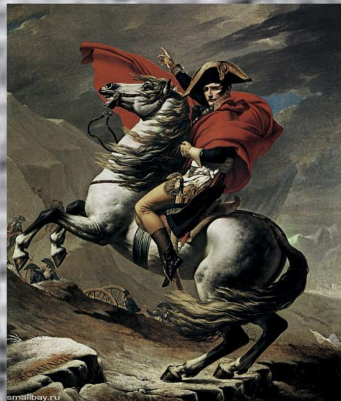
«Наполеон на перевале Сен-Бернард»