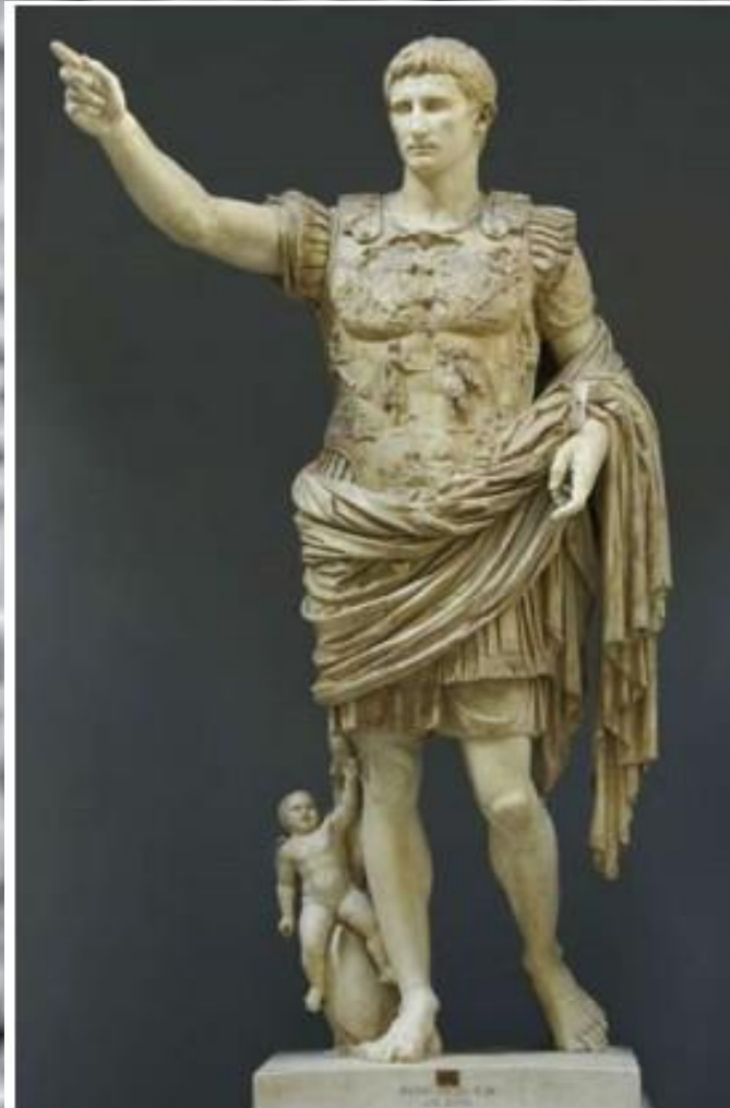
Август из Прима Порто. Римская статуя

Искусство как проявление свободных, творческих сил человека, полет его фантазии и духа часто использовалось для укрепления власти, — светской и религиозной.