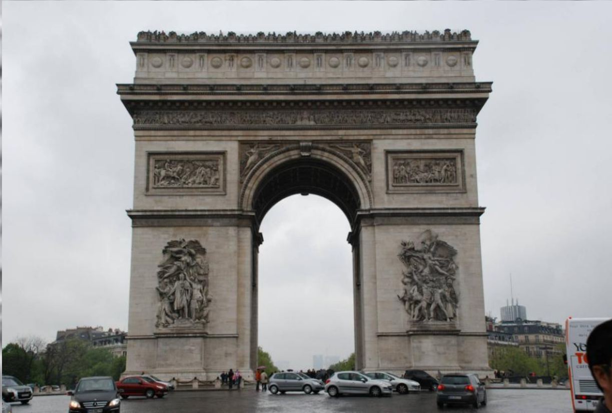
Франция, Париж, Триумфальная Арка

по указу Наполеона I, который хотел увековечить славу своей армии, построены Триумфальные ворота в Париже. На стенах арки выгравированы имена генералов, сражавшихся вместе с императором.