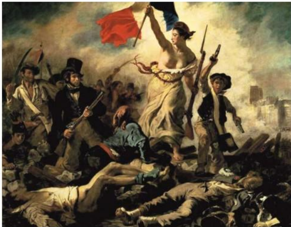
Э. Делакруа. Свобода, ведущая народ на баррикады

Благодаря произведениям искусства власть укрепляла свой авторитет, а города и государства поддерживали престиж. Искусство воплощало в зримых образах идеи религии, прославляло и увековечивало героев.