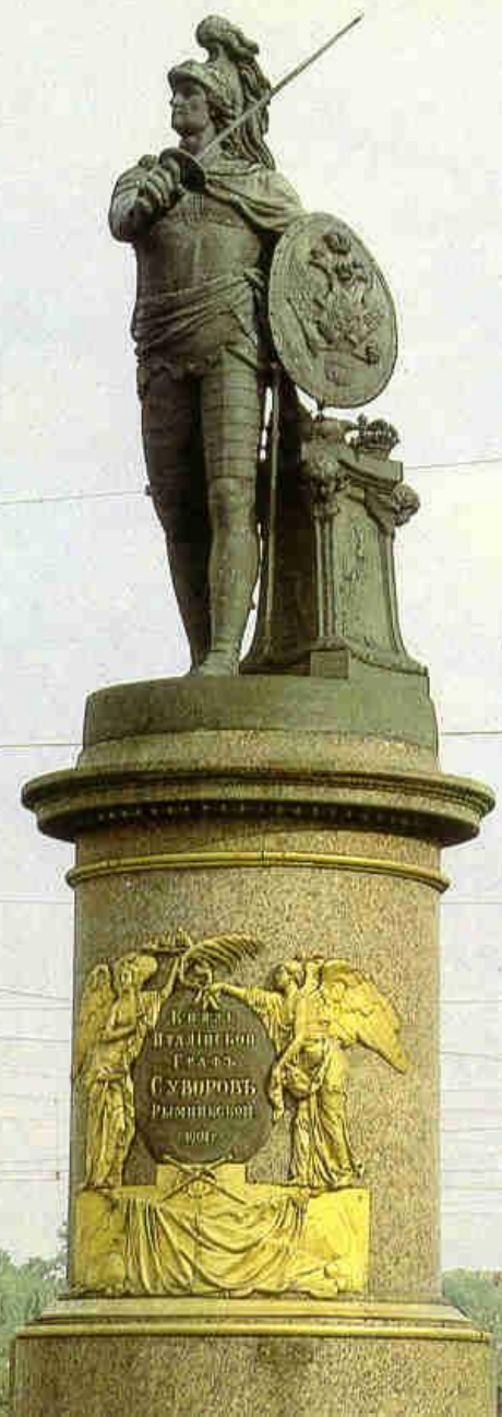
М.И.Козловский. Памятник А.В. Суворову. 1801 г. Санкт-Петербург