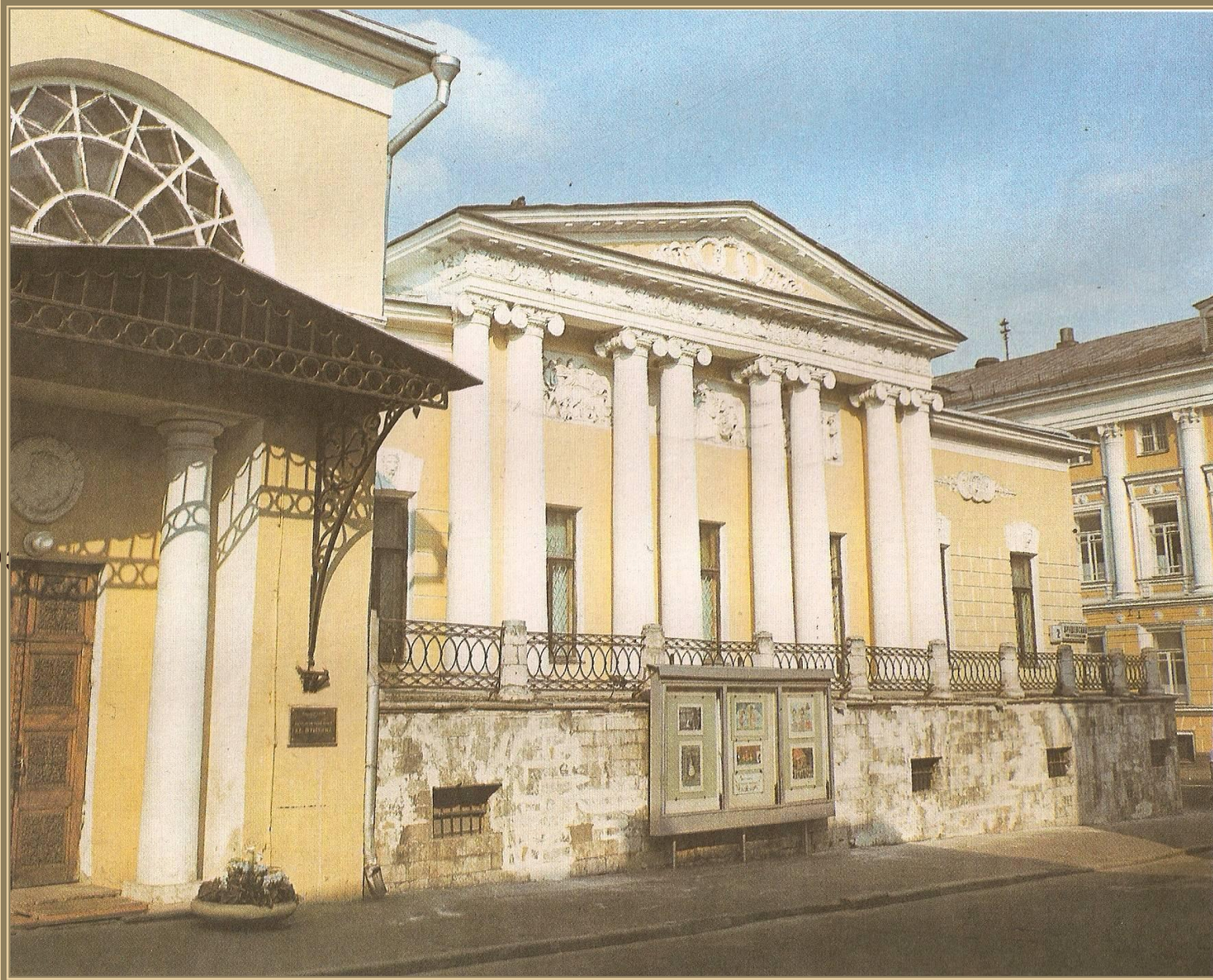
Дом-музей Пушкина в Москве.