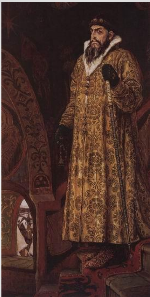
Картина «Царь Иван Васильевич Грозный»