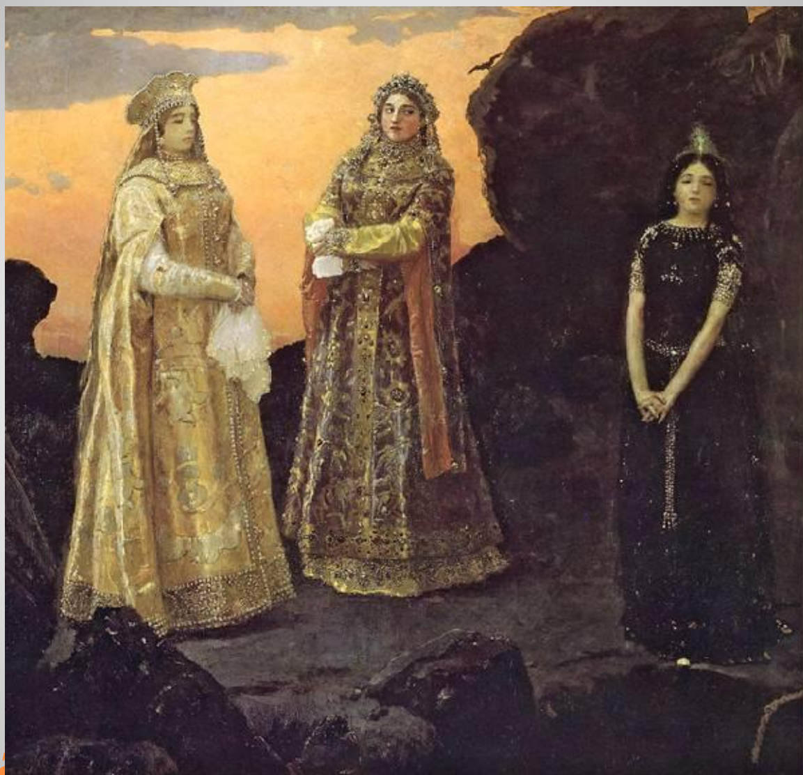
Три царевны подземного царства