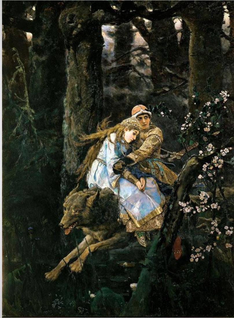
Иван-Царевич на Сером Волке