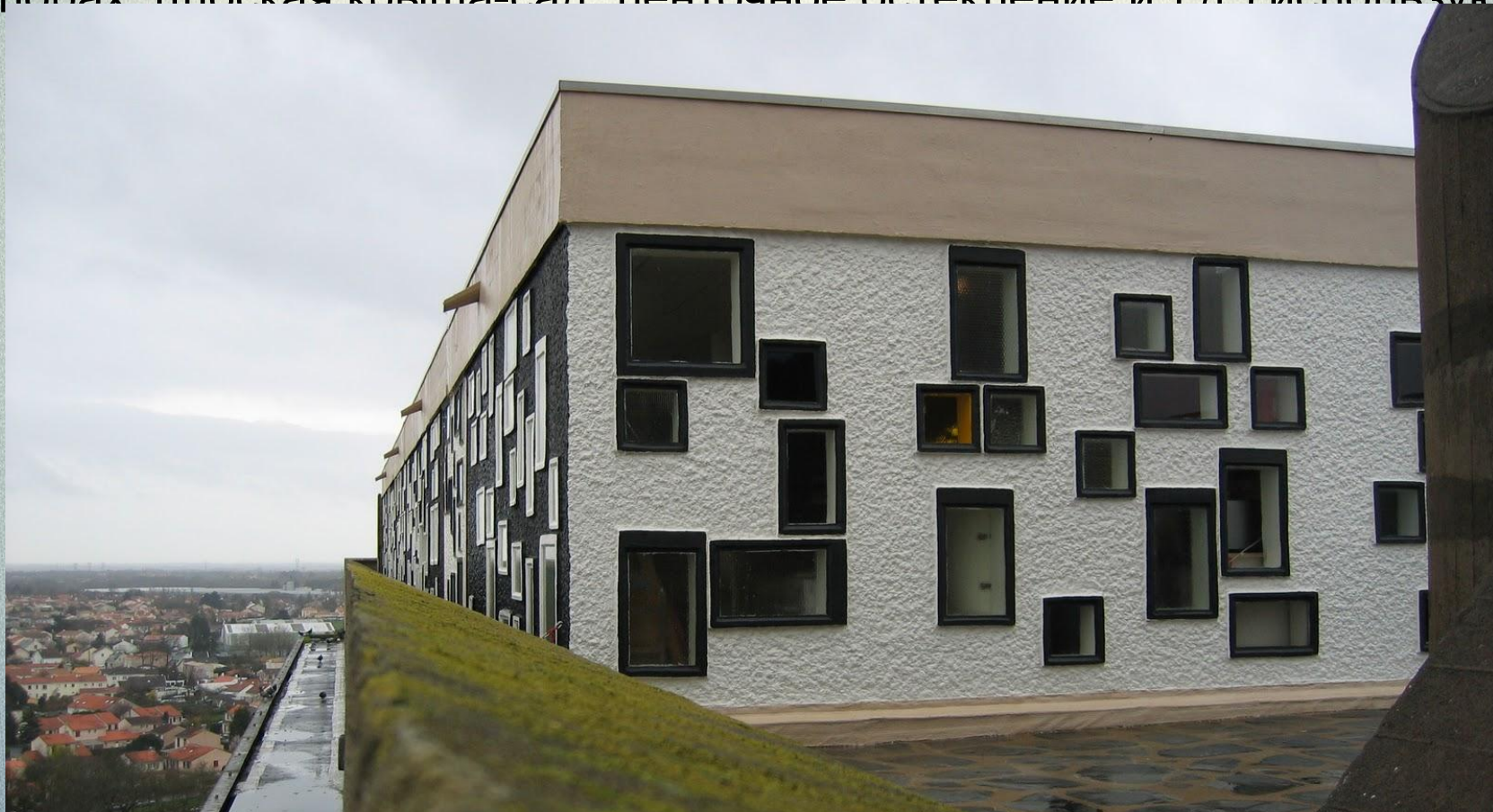
Нант-Резе, многоквартирный дом. Детский сад на крыше. Ле Корбюзье.

Этот поистине величайший архитектор современности насытил теорию функционализма идеологически и практически, его знаменитые принципы построения массового индустриального жилого дома (дом на опорах, плоская крыша-сад, пентхаусное остекление и т.д.) используются и