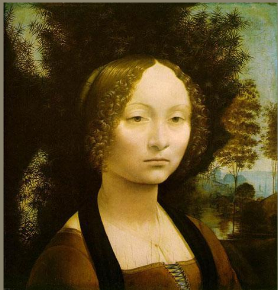
портрет Джиневры де Бенчи