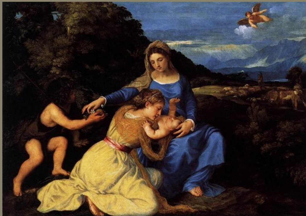
Мадонна с младенцем и святыми