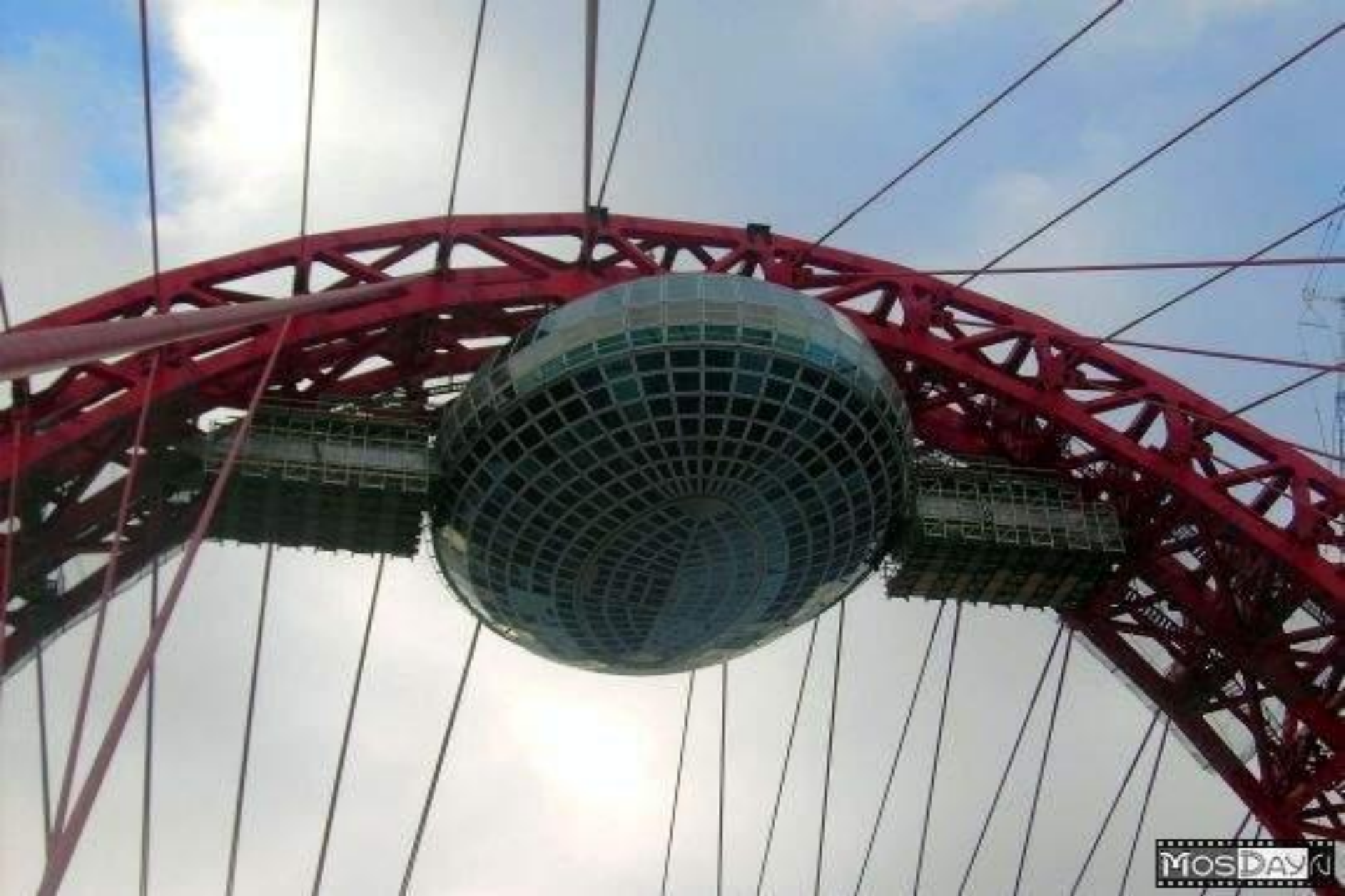
Пилон “Живописного моста” крупным планом вместе со строящимся рестораном и смотровой площадкой.