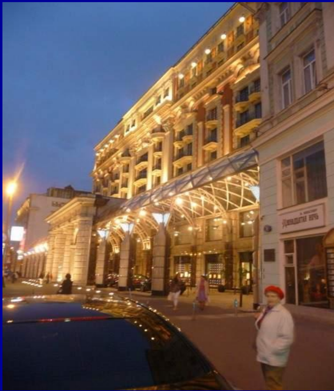
Гостиница “Ritz-Carlton”, построена на месте гостиницы “Интурист.”