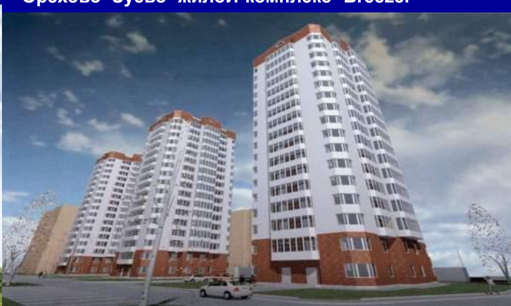
Жилой комплекс "Северное Трио."