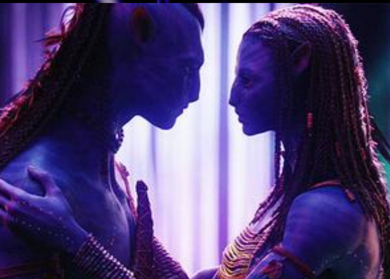
Нейтири и Джейк.