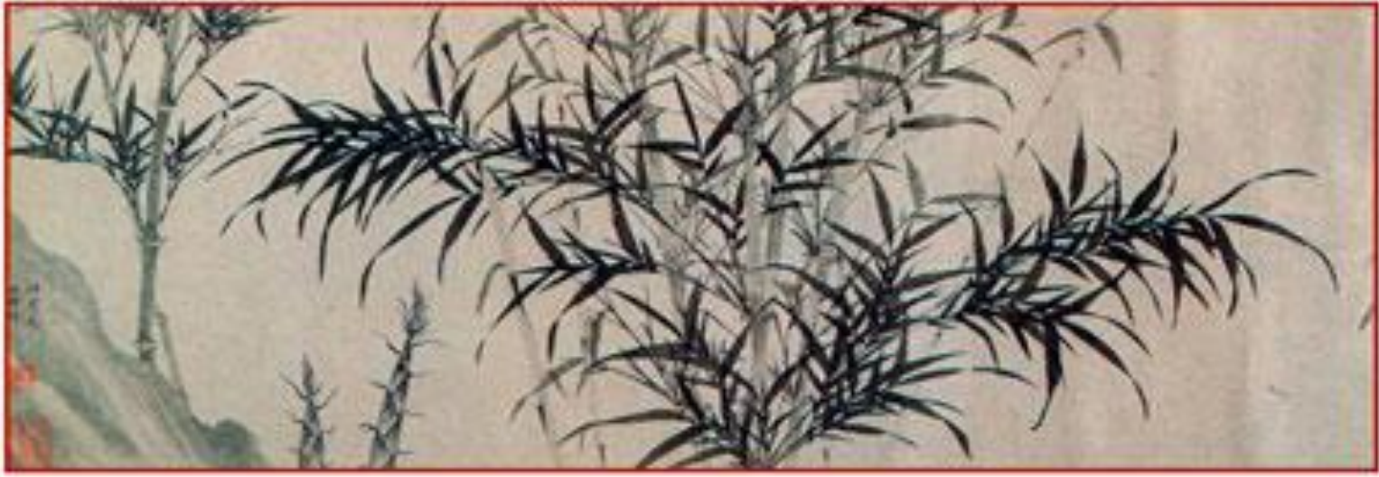
Ли Кан. Бамбук. Тушь по бумаге. XIII в.