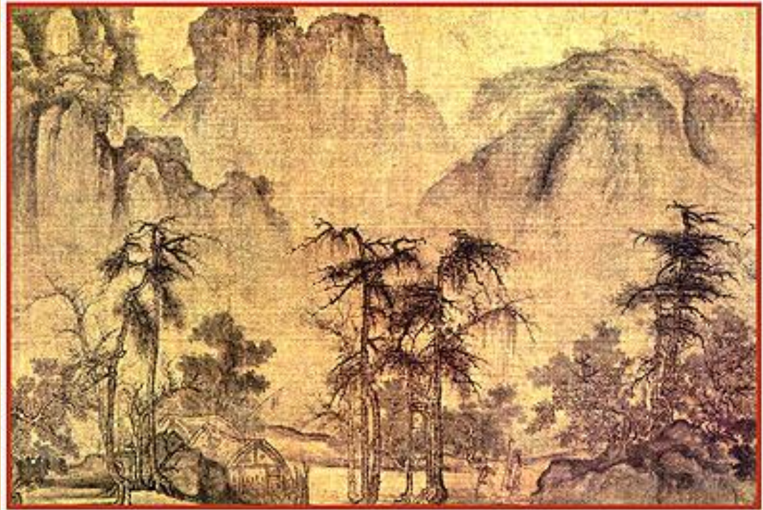
ГО СИ ОСЕНЬ В ДОЛИНЕ ЖЕЛТОЙ РЕКИ

Одним из высших достижений древнекитайского искусства является живопись, в особенности живопись на свитке. Китайская картина-свиток - это совершенно новый вид искусства, созданный специально для созерцания. Основными жанрами живописи на свитке были исторический и бытовой портрет, портрет, связанный с заупокойным культом, пейзаж, жанр «птицы и цветы».