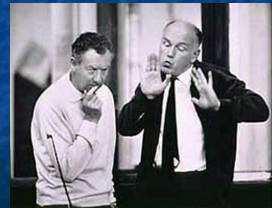
Со С. Рихтером