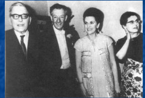
С Д. Шостаковичем

Бриттен никогда не был популярен в России. Однако тонкие музыканты, такие как Дмитрий Шостакович или Святослав Рихтер, дружившие с композитором, знали настоящую цену его таланта. Сейчас в России выпущены диски с музыкой композитора, прочитаны лекции, опубликованы научные статьи. Композитор написал 15 опер, столь же значимых для англичан, как для нас оперы Чайковского и Глинки. А некоторые из них -- "Питер Граймс" или "Поворот винта" -- стали уже оперной классикой.