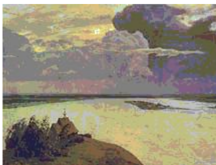
«Над вечным покоем»