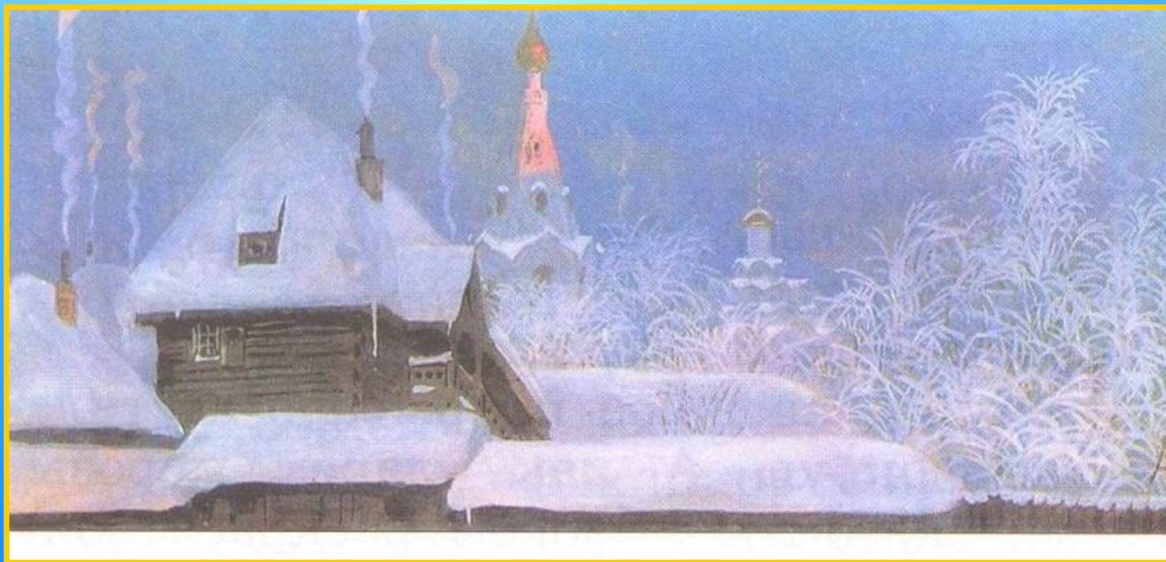
А. Рябушкин «Зимнее утро»