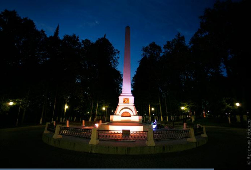
архитект. Александр Маматов © Артемий Лебедев