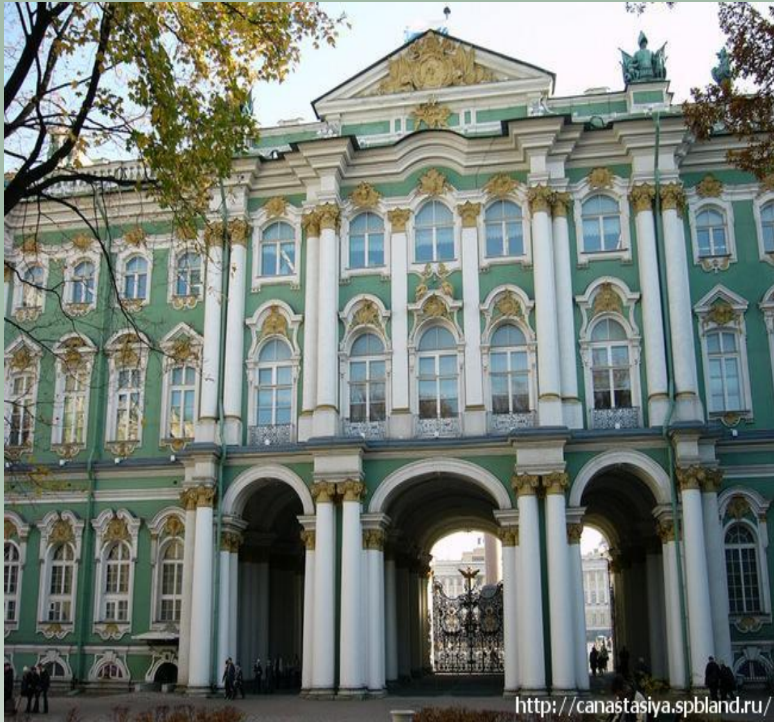
Зимний дворец (1754-1762), арх. Ф. Растрелли