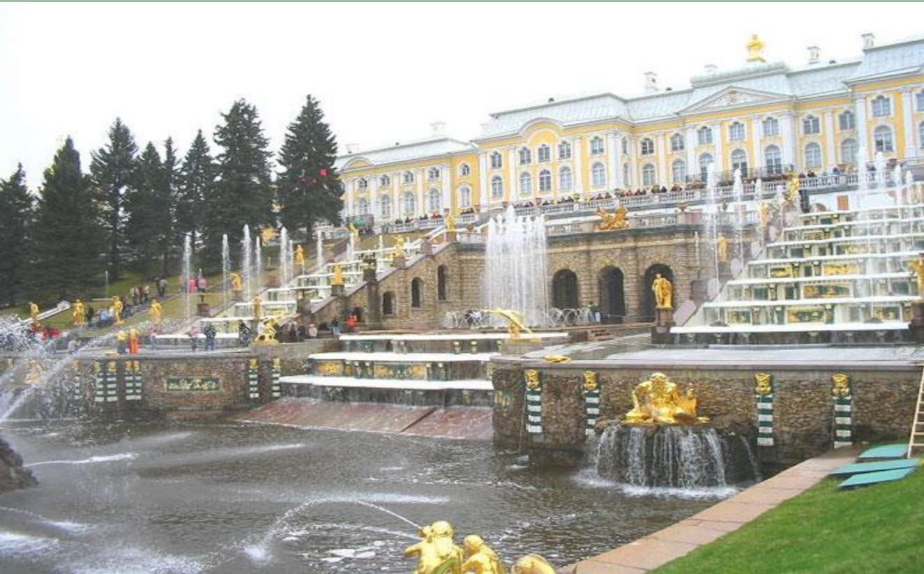
Большой Петергофский дворец, арх.Ф.Растрелли