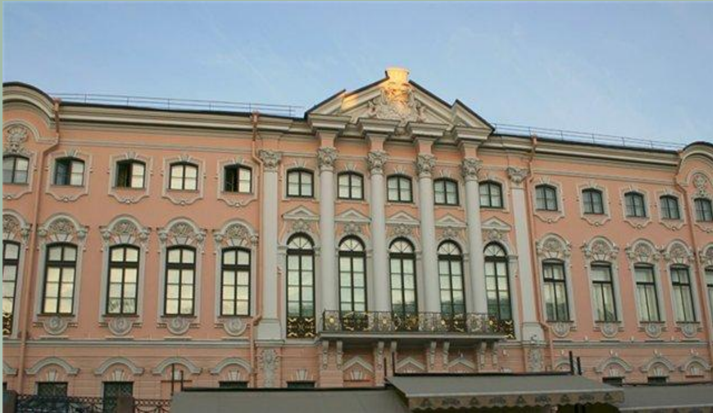
Строгановский дворец(1752-1754), арх. Ф.Растрелли