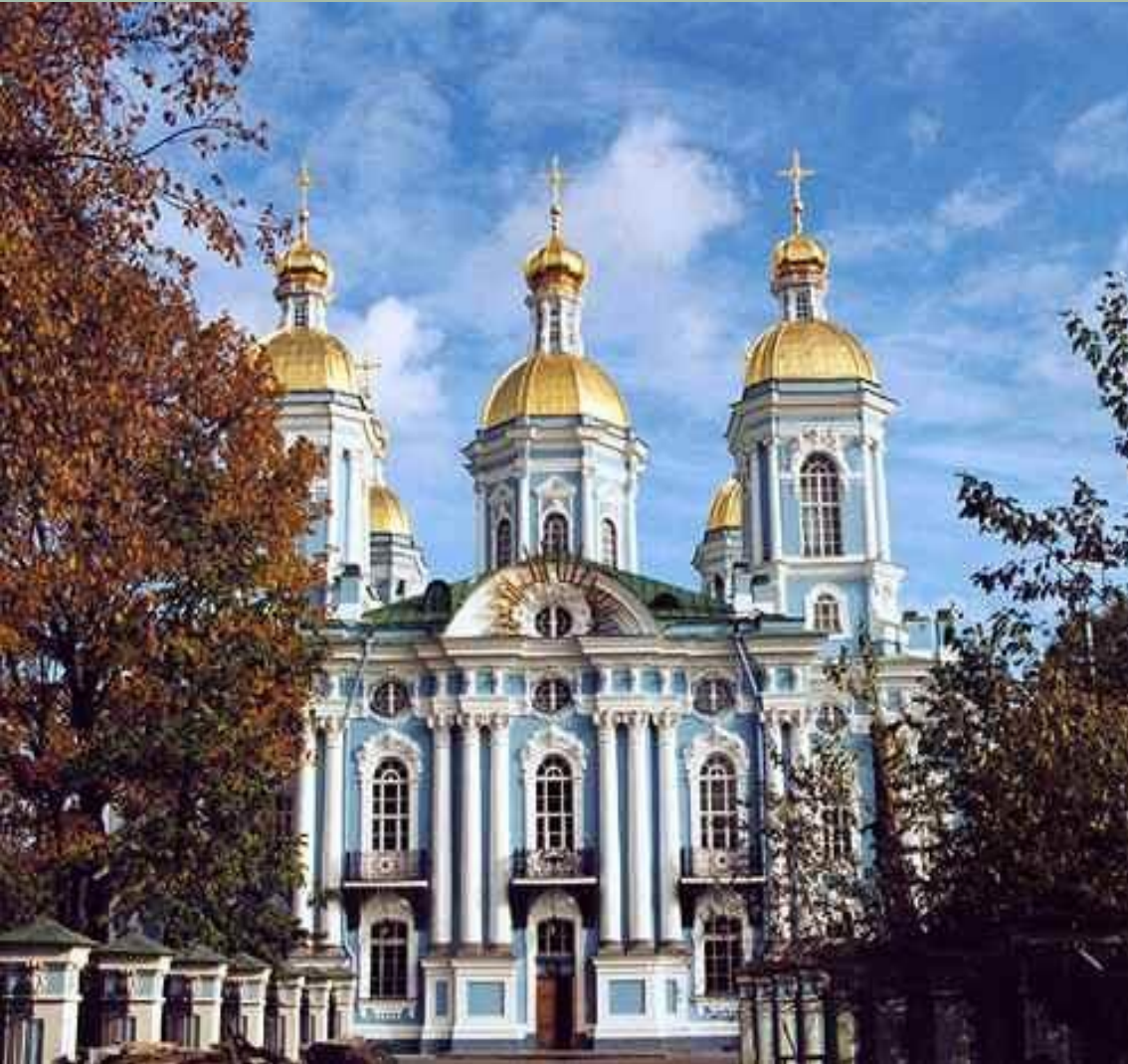
Никольский (Морской) собор, (1753-1762), арх. Чевакинский