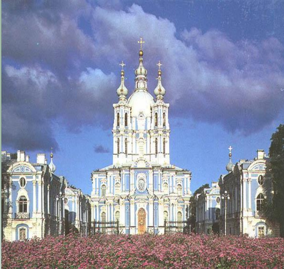
Смольный (Воскресенский Новодевичий) монастырь (1748-1764), арх. Ф. Растрелли