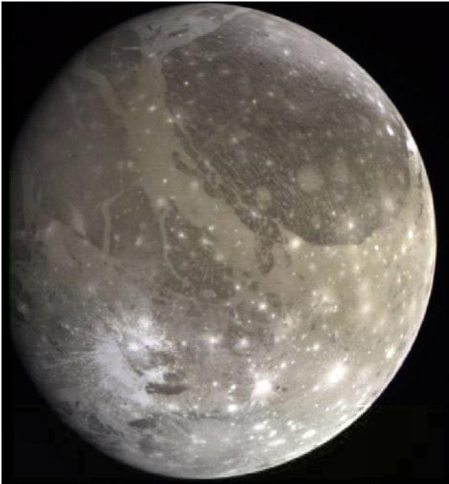
Ганимед. Спутник Юпитера.

В честь Ганимеда названы спутник Юпитера Ганимед, открытый в 1610 году Галилео Галилеем и астероид (1036) Ганимед, открытый в 1924 году немецким астрономом Валтером Бааде.