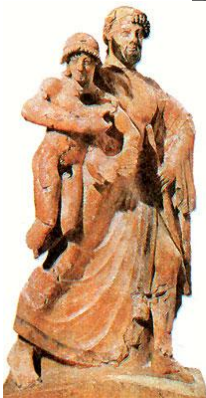
Зевс и Ганимед. Раскрашенная терракота. 470 г. до н. э. Олимпия

Ганимеду, как и обещал Зевс, была дарована вечная юность. Согласно поэтам, на Олимпе он стал любимцем Зевса и виночерпием на пирах богов, сменив на этом посту Гебу. Согласно Аристотелю, боги не пьют вина, и «виночерпий» Зевса, - переносное значение. По Цицерону, он подает богам нектар и амброзию.