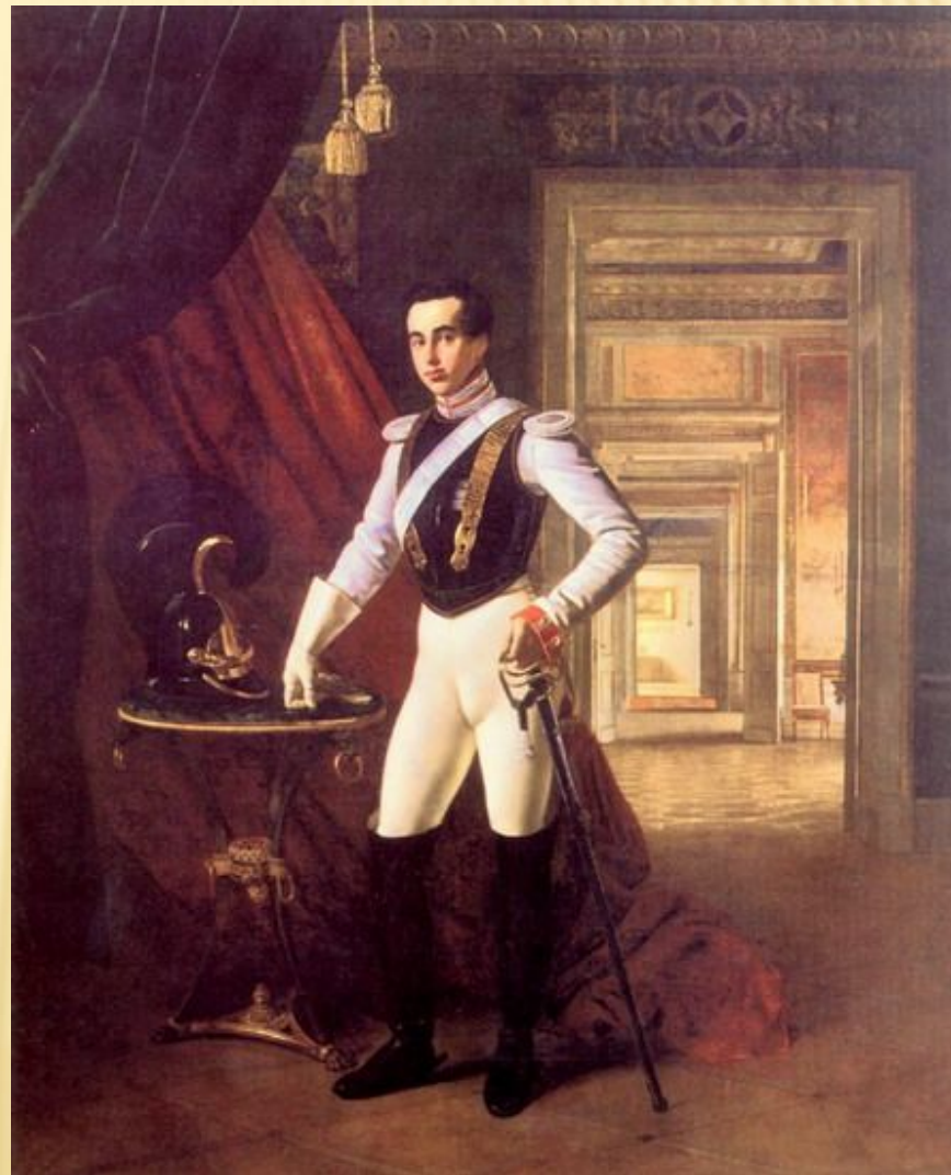
О. А. Кипренский

Н.П. Шереметев был влюблен в одну из актрис своего театра, имеющую псевдоним Жемчугова. Тогда многим крепостным актрисам вместо их простых фамилий давали имена по названиям драгоценных камней.