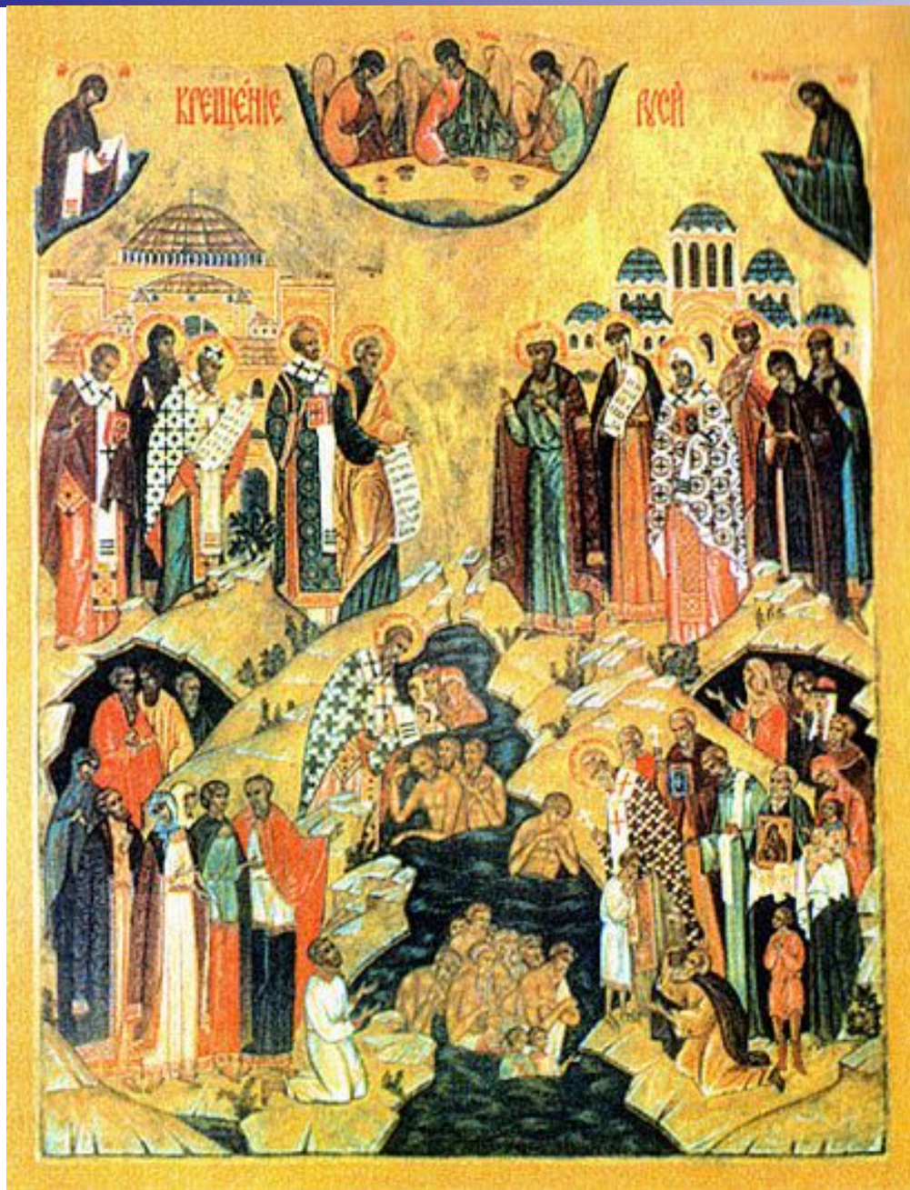
«Крещение Руси» Икона