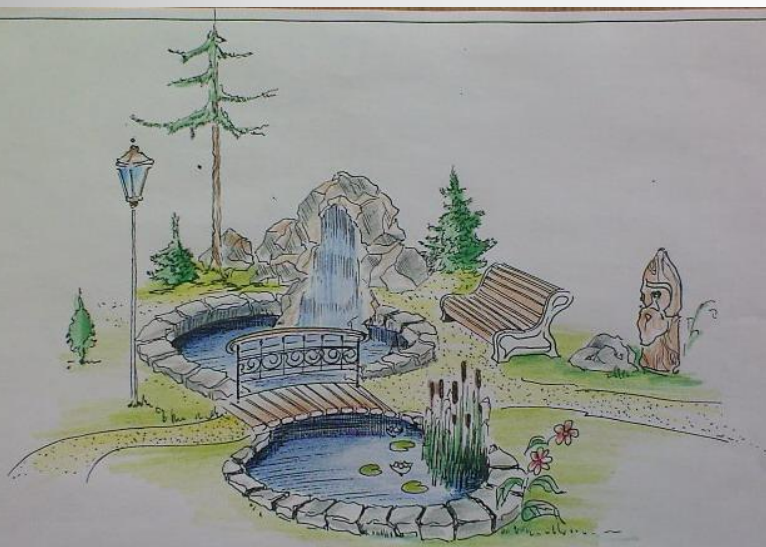
УГОЛОК ЛЯХОГО ОТДЫХА