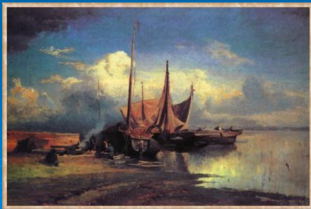
«Перед дождем». Третьяковская галерея.