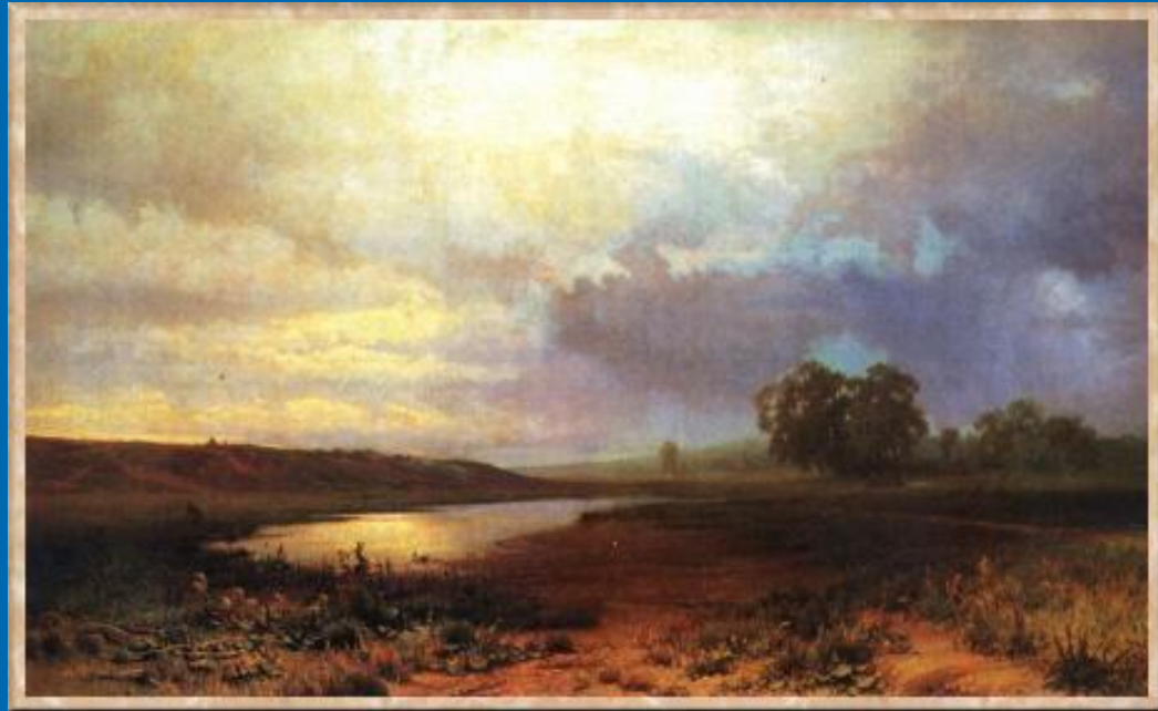
«Мокрый луг». 1872. Третьяковская галерея.

Но не во внешних эффектах здесь суть. В произведениях Васильева природа, словно откликаясь на движения человеческой души, в полном смысле психологизируется, выражая сложную гамму чувств между отчаянием, надеждой и тихой грустью. Наиболее известны картины «Оттепель» (1871) и «Мокрый луг» (1872; обе в Третьяковской галерее), где постоянный интерес художника к переходным, неопределенно-зыбким состояниям природы претворяется в образы озарения сквозь меланхолическую мглу. Это — своего рода натурные сны о России, выдерживающие сопоставление с пейзажными мотивами И. С. Тургенева или А. А. Фета.