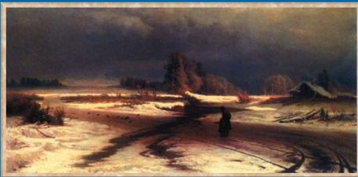
Оттепель. 1871. Масло