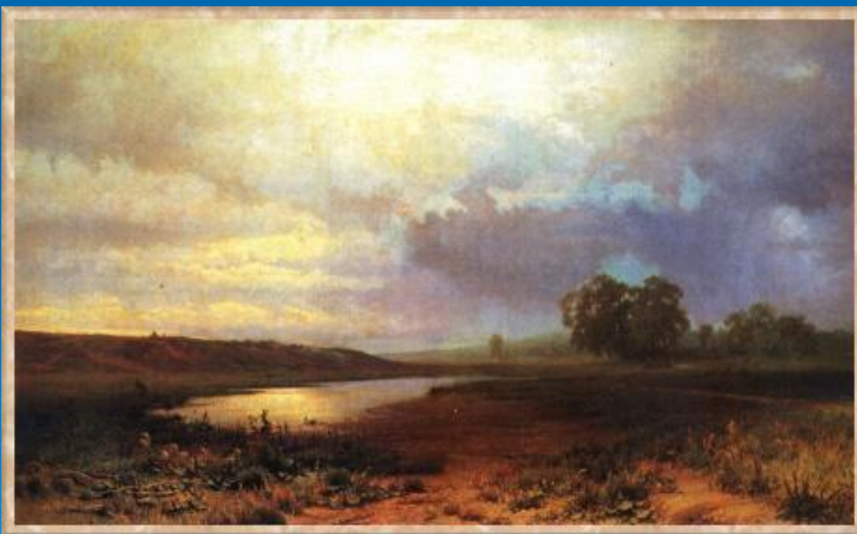
Мокрый луг. 1872. Масло