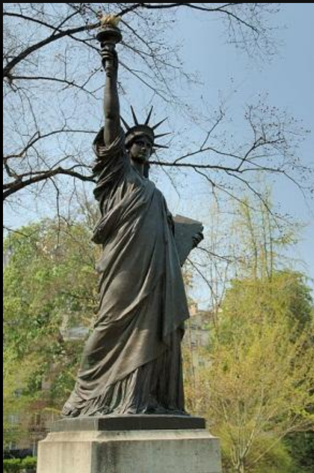
В Люксембургском саду