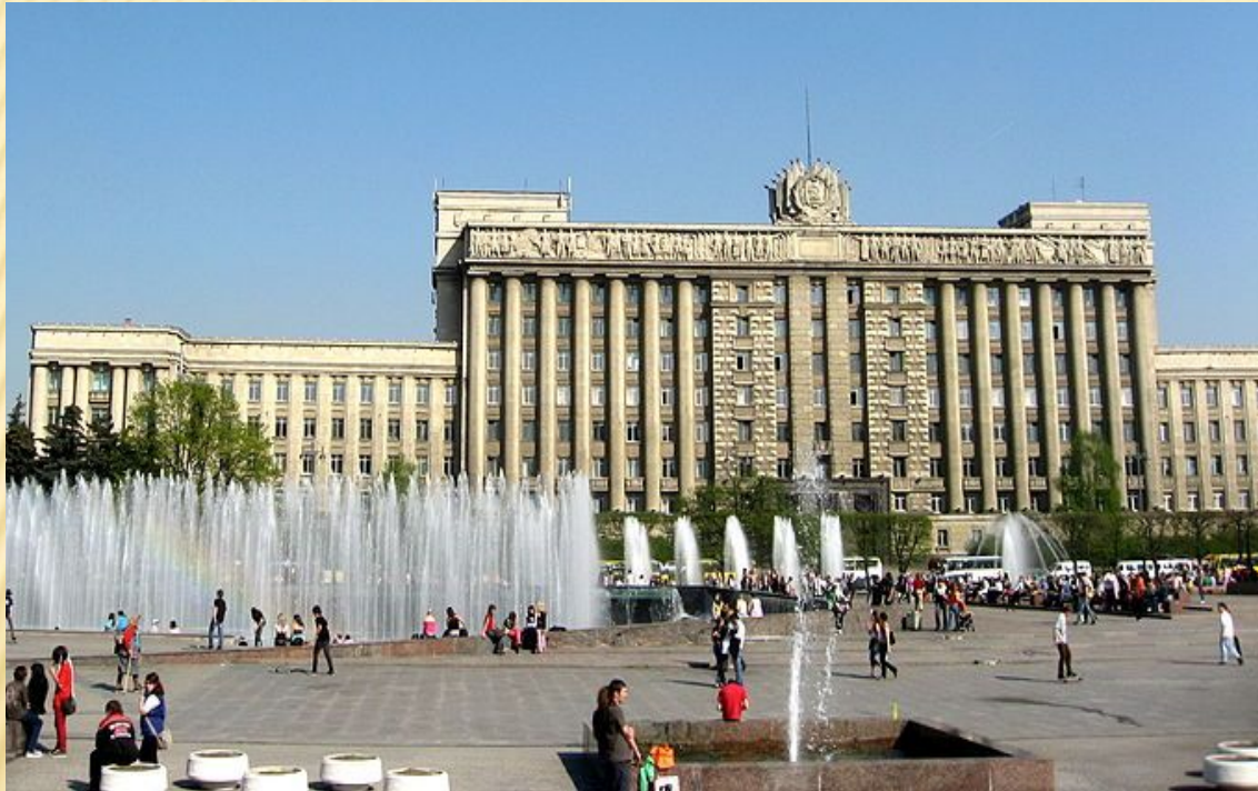
Дом Советов. Арх. Н. А. Троцкий, Я. Н. Лукин, М. А. Шепилевский и др. 1936—1941

Отличительными чертами стиля являются преимущественно крупные архитектурные формы, включая целые ансамбли, частое применение различных архитектурных ордеров, богатая по тому времени наружная отделка с барельефами, скульптурами, рустикой, наличниками, применение бетона, металла, натурального камня. В официальных зданиях предусматривалась богатая отделка интерьеров, в жилых домах — улучшенная планировка, наличие всех инженерных систем.