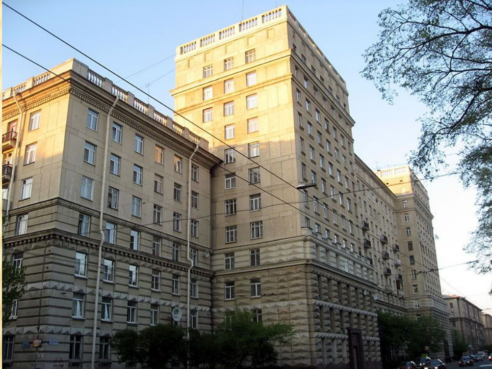
Первый 12-этажный дом на ул. Кузнецовской, 44. Арх. Журавлев (в соавторстве с арх. А.Д. Кацем и инженером Н.И. Дюбовым)

Для советского минимализма характерны крупнопанельные жилые, общественные и производственные здания, отличающиеся отсутствием каких-либо элементов отделки на фасадах, кроме окраски или облицовки керамическими плитками. Наряду с крупнопанельными домами возводили и крупноблочные здания, а также кирпичные дома. Строительные нормы и правила, введённые в 1955—1957 годах, предусматривали минимум удобств для жителей: комнаты размером 9-12 м 2 , высоту помещений 2,5 м, совмещённые санузлы и др. Однако в то время индустриальное строительство привело к быстрому улучшению жилищных условий сотен тысяч горожан, многие из которых впервые получили отдельные квартиры.