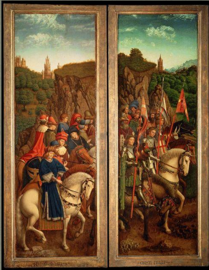
Праведные Судьи и Воинство Христово