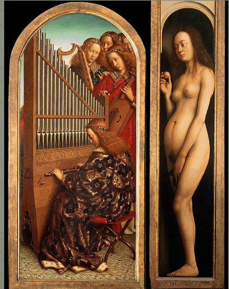
Ангелы и Ева