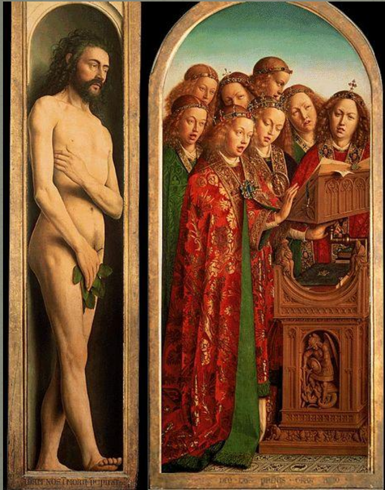
Адам и ангелы