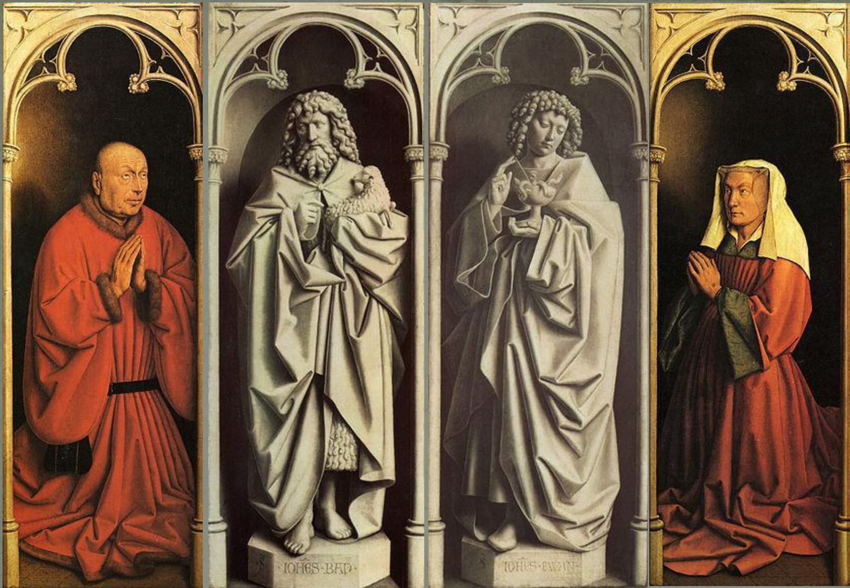
Донатор (заказчик алтаря)