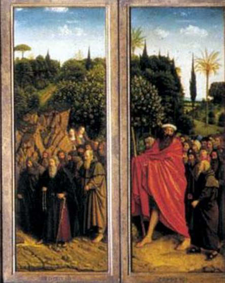
Van Eyck 1432