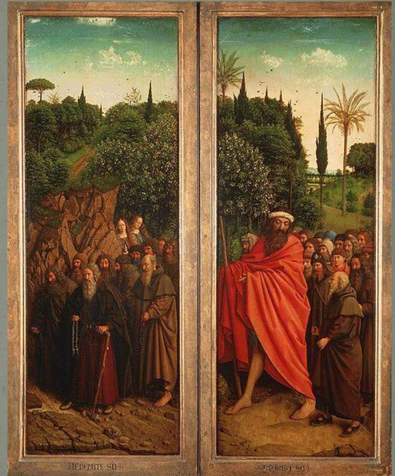
Шествие отшельников и пилигримов