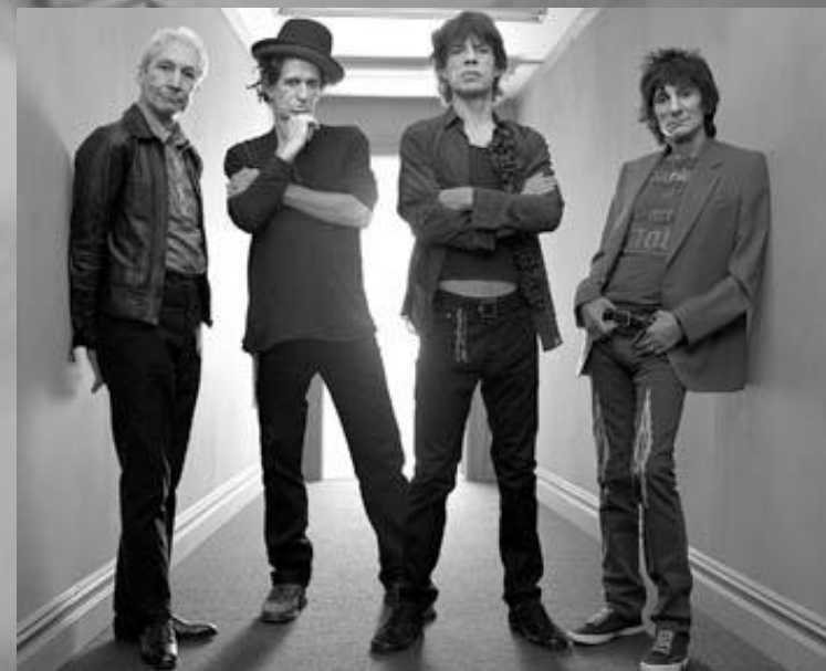
Яркие представители битников – Rolling Stones