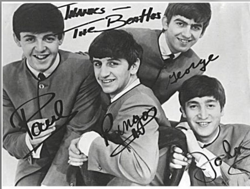
Одна из самых известных рок-групп мира, основоположники рок-музыки - The Beatles

Накануне того, как в Англию по разным каналам начал проникать рок-н-ролл, молодёжной среде были известны две группировки - «тэдди бойз» и «битники».