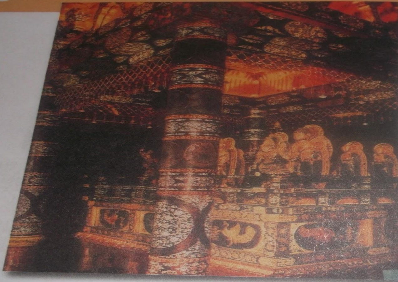
Алтарь буддийского монастыря

из пес кая го Мéру. земно ливак У В ТОМ КОВ, ХОДИ КОНУ ТЕЛЕ ПРИ В МОН ЩИХ