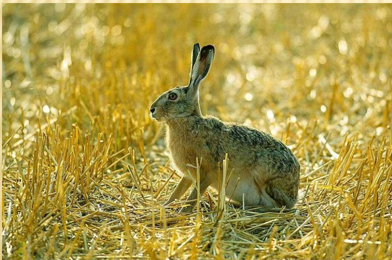
Заяц русак – Lepus caproreus