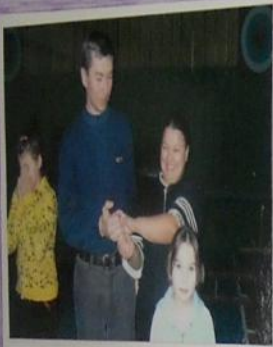
Это папа, это мама, это я Вместе мы - спортивная семья.

НОМИНАЦИЯ «Фитнеспортсмен» Виталик, Га, Светлана, Валерия 4 класс, МКОУ СОШ с. Суровики