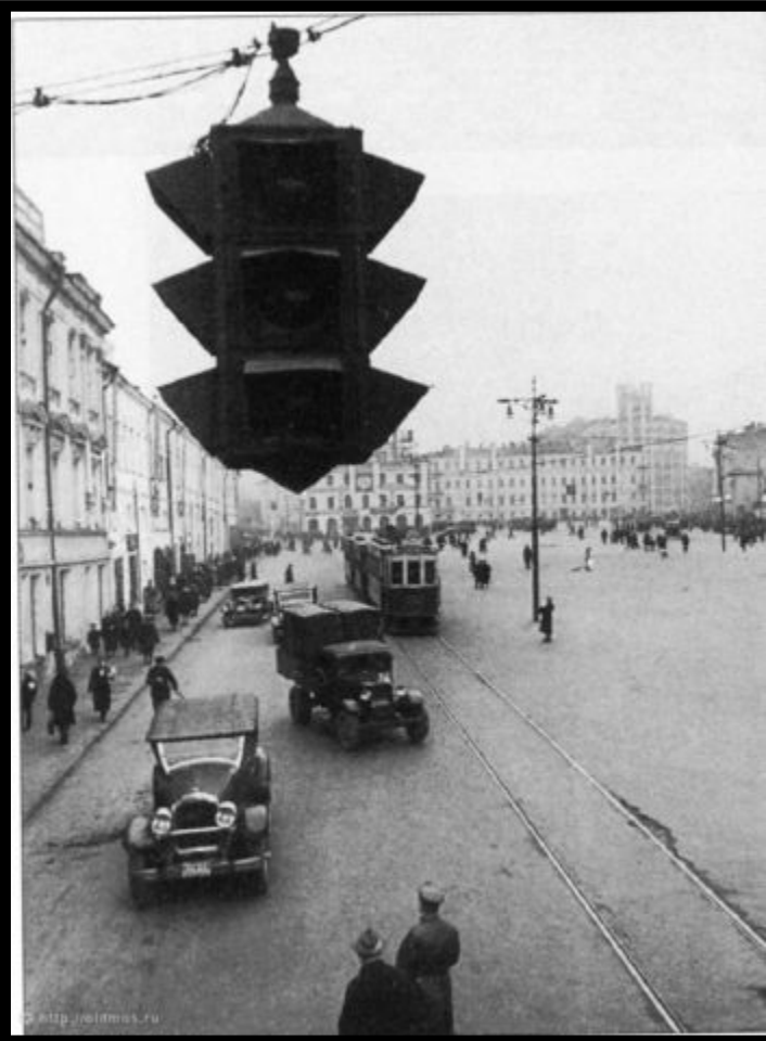
Москва 30-е годы

В Советском Союзе эксплуатация первого светофора началась 15 января 1930 года в Ленинграде, а в декабре того же года первый светофор заработал в Москве.