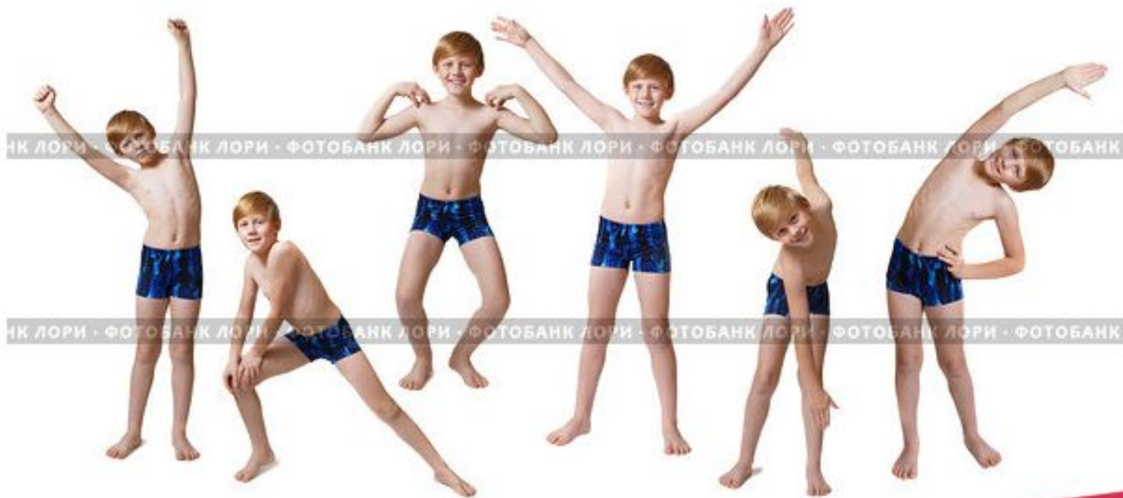
Подросток, делающий зарядку