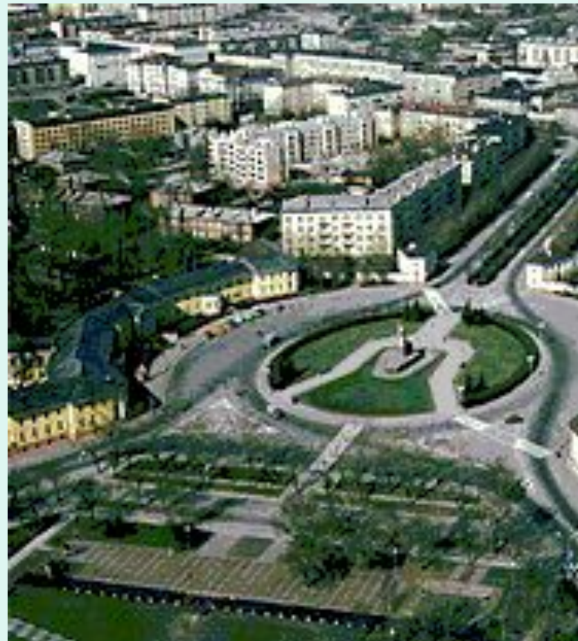
Панорама г. Петрозаводска