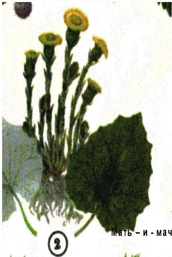
Мать – и – мачеха