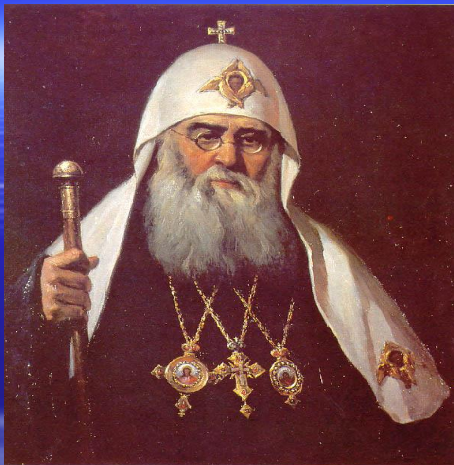
Святейший Патриарх Сергий