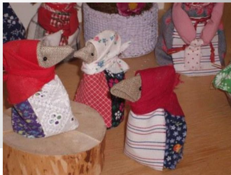
Каргопольская кукла Карга

«Белозерский князь Вячеслав, возвращаясь из похода к Белому морю, нашел поле, удобное для отдохновения. Немало удивило князя и его воинов то множество ворон, которое было там. Потому назвал князь поле оное Каргиным полем и учредил там свой стол. Россияне же сделали на поле том острог.»