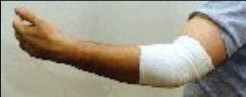
Повязка на коленный и локтевой суставы