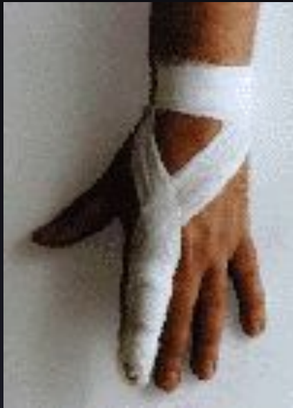
Повязки при ранении пальцев