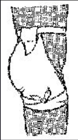
Косыночная повязка ягодичной области