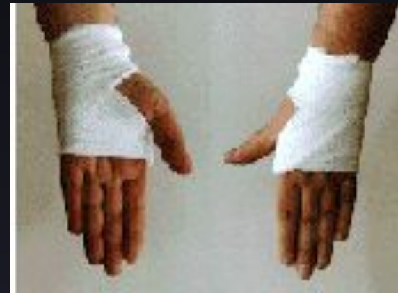
Повязки при ранении кисти