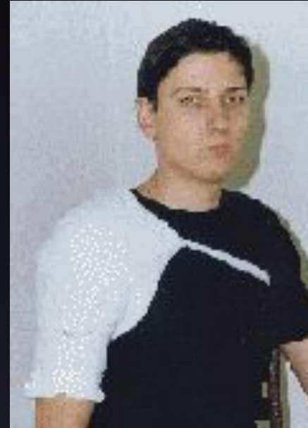
Косыночная повязка на плечевой сустав