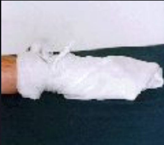
Косыночная повязка на кисть