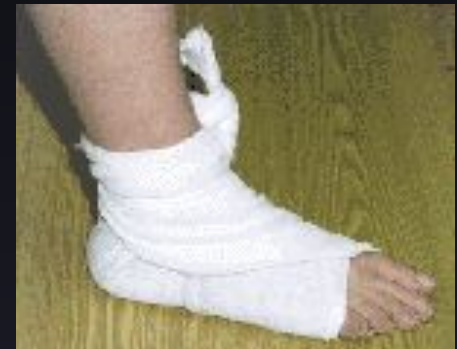
Косыночная повязка на голеностопный сустав и пятку