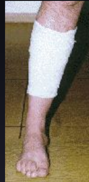
Спиральная повязка на голень, предплечье