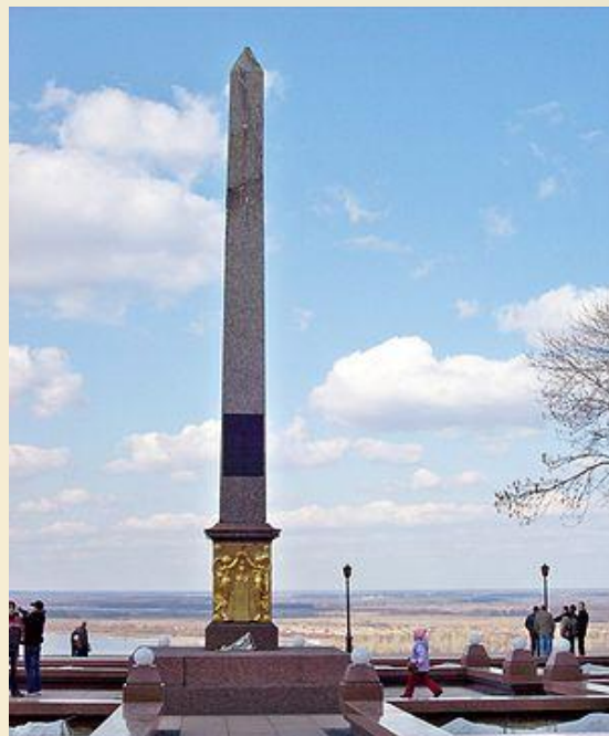
Обелиск в честь Минина и Пожарского в Нижнем Новгороде