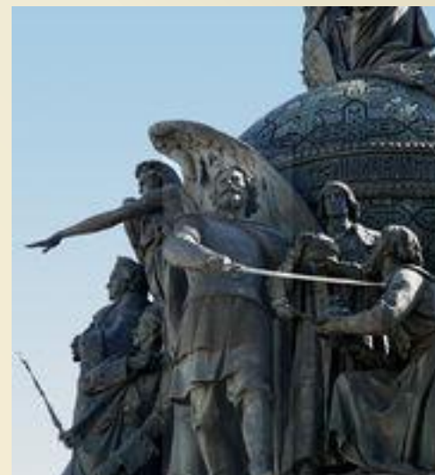
Дмитрий Пожарский на Памятнике «1000-летие России» в Великом Новгороде