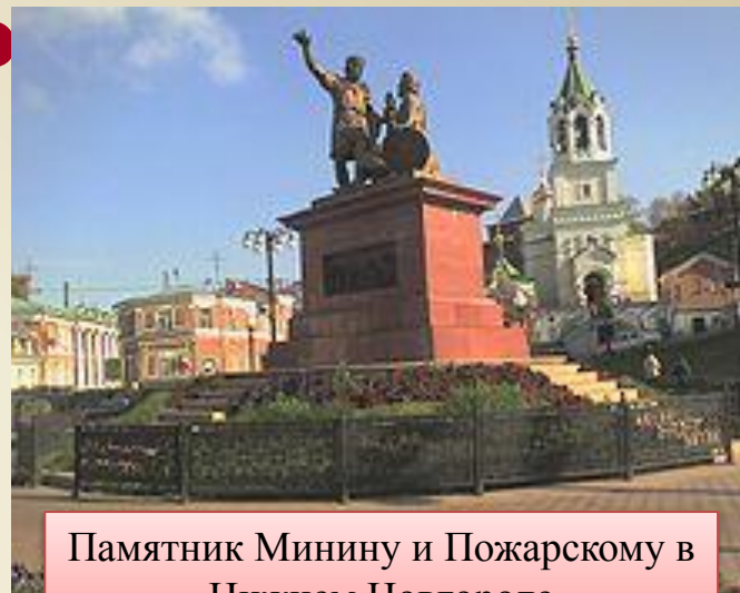
Памятник Минину и Пожарскому в Нижнем Новгороде