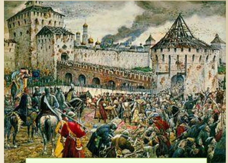
Изгнание поляков из Кремля

Пожарский предлагал осажденным свободный выход со знаменами и оружием, но без награбленных сокровищ. Они предпочли питаться пленными и друг другом, но с деньгами расставаться не желали. Пожарский с полком встал на Каменном мосту у Троицких ворот Кремля, чтобы встретить боярские семьи и защитить их от казаков. 26 октября (5 ноября) 1612 поляки сдались и покинули Кремль. 27 октября (6 ноября) 1612 был назначен торжественный вход в Кремль войск князей Пожарского и Трубецкого.