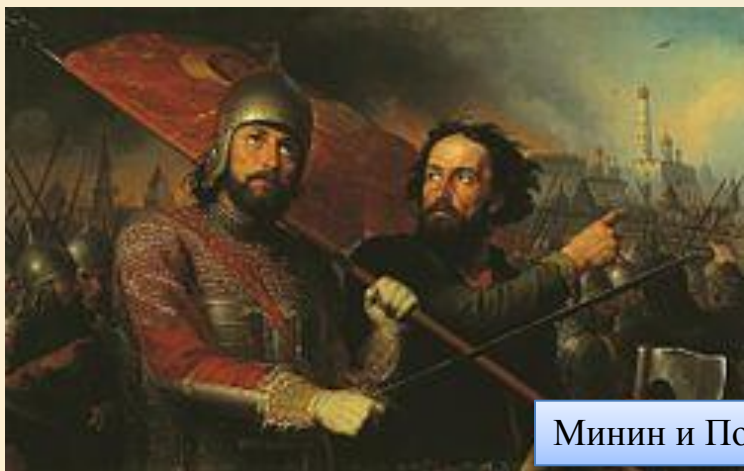
Минин и Пожарский

И не случайно, в связи с вышесказанным, что оплотом дальнейшей национально-освободительной борьбы русского народа за свою независимость и форпостом создания второго народного ополчения становится именно Нижний Новгород.