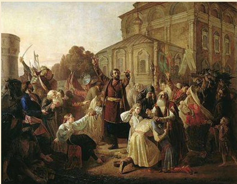
Воззвание Минина к нижегородцам в 1611 году

Инициатива организации Второго народного ополчения исходила от ремесленно-торговых людей Нижнего Новгорода, важного хозяйственного и административного центра на Средней Волге. Нижний Новгород по своему стратегическому положению, экономическому и политическому значению был одним из ключевых пунктов восточных и юго-восточных районов России.