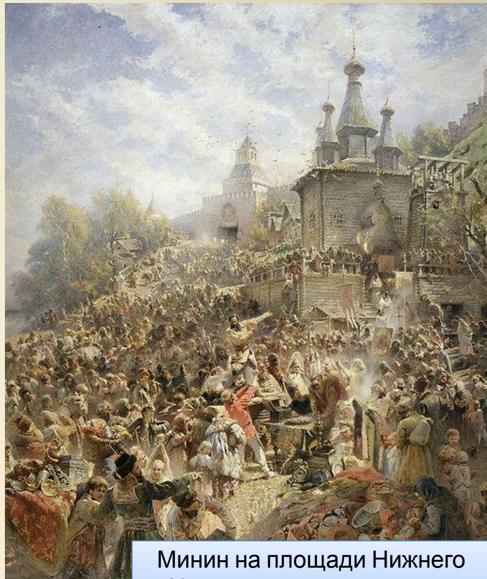
Минин на площади Нижнего Новгорода, призывающий народ к жертвованиям