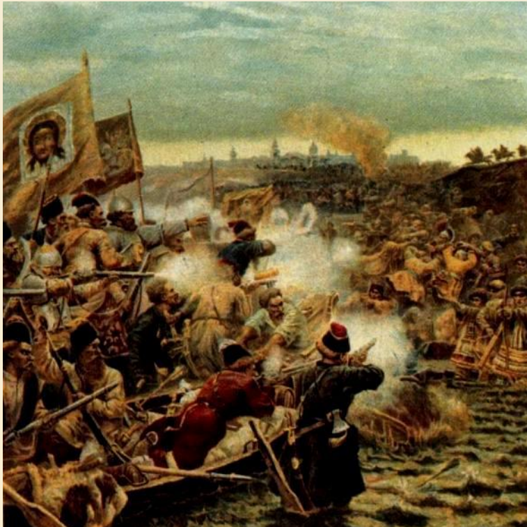
Первый день Московской битвы между войсками Второго народного ополчения и польско-литовской армией гетмана Ходкевича

Второе ополчение выступило на Москву из Нижнего Новгорода в конце февраля — начале марта 1612 года через Балахну, Тимонькино, Сицкое, Юрьевец, Решму, Кинешму, Кострому, Ярославль. В этих городах ополченцы были встречены с честью. Они получили пополнение и большую денежную казну. В Ярославле ополченское правительство продолжило замирение городов и уездов, освобождение их от польско-литовских отрядов и от казаков Заруцкого. В это же время князь Пожарский провёл дипломатические переговоры с Иосифом Грегори, послом германского императора, об оказании императором помощи ополчению в освобождении страны. Ко Второму ополчению присоединились большое число понизовых и подмосковных городов с уездами, Поморье и Сибирь. Постепенно устанавливался порядок на всё более значительной территории государства. Постепенно, с помощью отрядов ополченцев, она очищалась от воровских шаек. Ополченское войско уже насчитывало до десяти тысяч ратников, хорошо вооружённых и обученных. Власти ополчения занимались и повседневной административной и судебной работой (назначение воевод, ведение разрядных книг, разбор жалоб, челобитий и пр.).