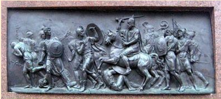
Победа народного ополчения над поляками. Горельеф с памятника Минину и Пожарскому.

Когда войска собрались у Лобного места, архимандрит Троице-Сергиевого монастыря Дионисий совершил торжественный молебен в честь победы ополченцев. После чего под звон колоколов победители в сопровождении народа вступили в Кремль со знамёнами и хоругвями.