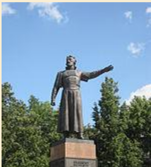
Памятник Кузьме Минину в Нижнем Новгороде