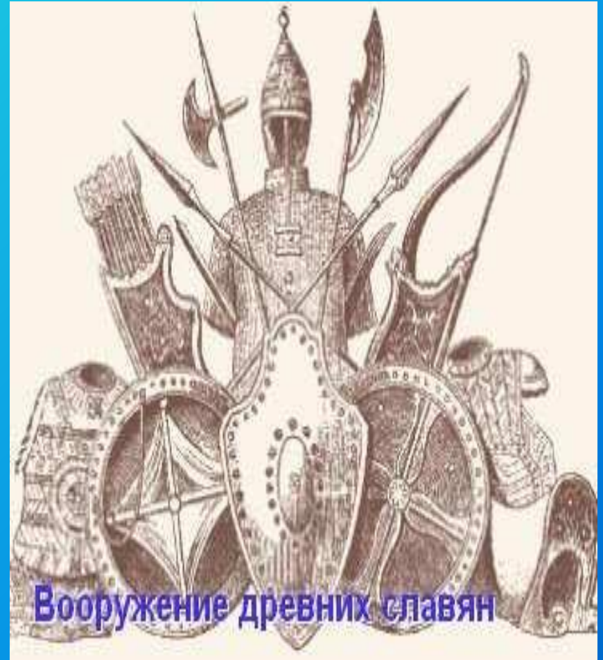
Вооружение древних славян