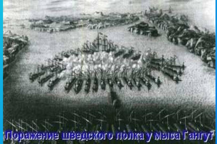
Поражение шведского полка у мыса Гангут