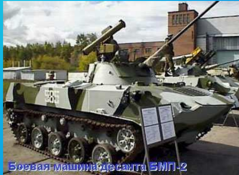
Боевая машина десанта БМП-2