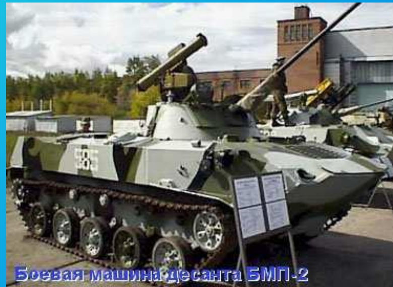
Боевая машина десанта БМП-2