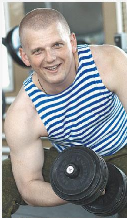
Российские Вооружённые силы наращивают мускулы.

*Минимальная сумма в месяц **С учётом выслуги лет