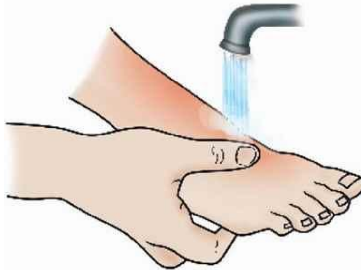
Ожоги лучше промыть холодной водой...