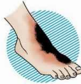
III–IV степень – обугливание кожи и тканей (до кости)