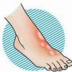
II степень – образование пузырей на коже