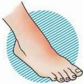
I степень – покраснение кожных покровов