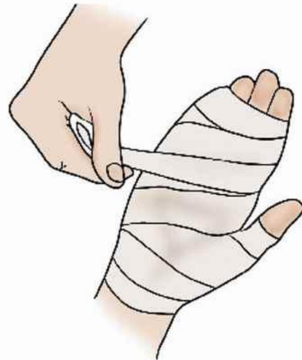
Затем наложить повязку и отправиться к врачу