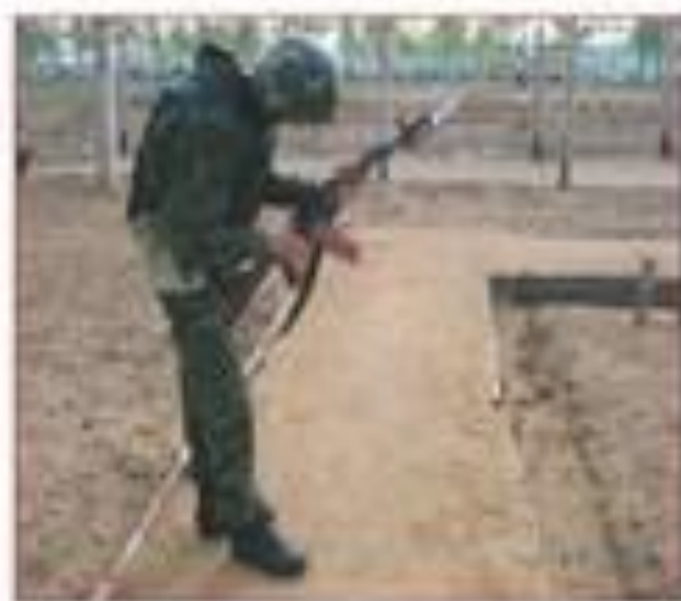
Досылать без надобности патрон в патронник