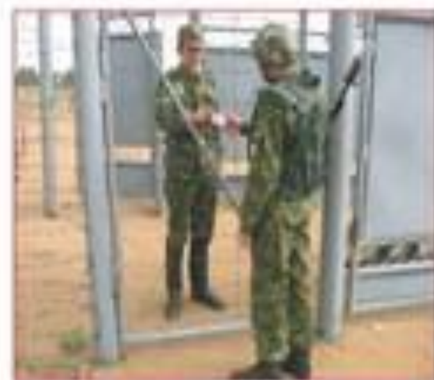
Принимать от кого-либо или отдавать кому-либо предметы