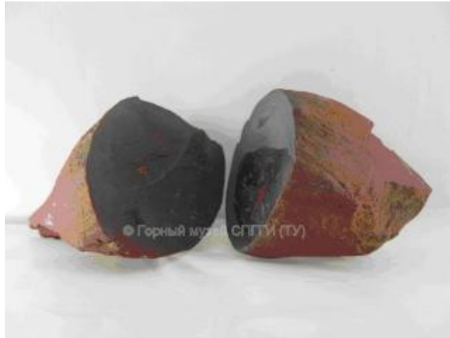
Вулканическая крученая бомба (в разрезе).