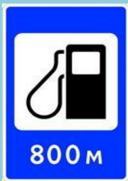
авто заправочная станция

А ещё есть знаки- добрые друзья: Укажут направление вашего движения, Где поесть, заправиться, поспать, И как в деревню к бабушке попасть.