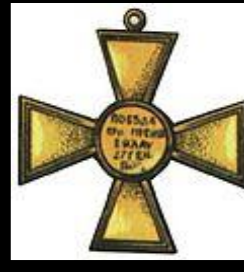
Крест за Прейсиш-Эйлау