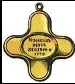
Крест за Измаил