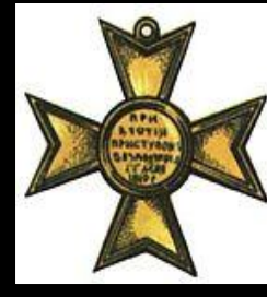
Крест за Базарджик