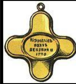
Крест за Измаил