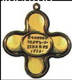
Крест за Очаков