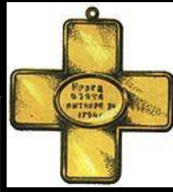
Крест за Прагу