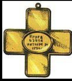
Крест за Прагу