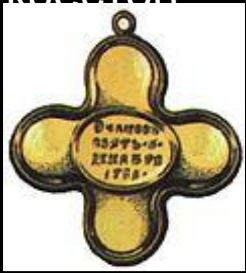
Крест за Очаков