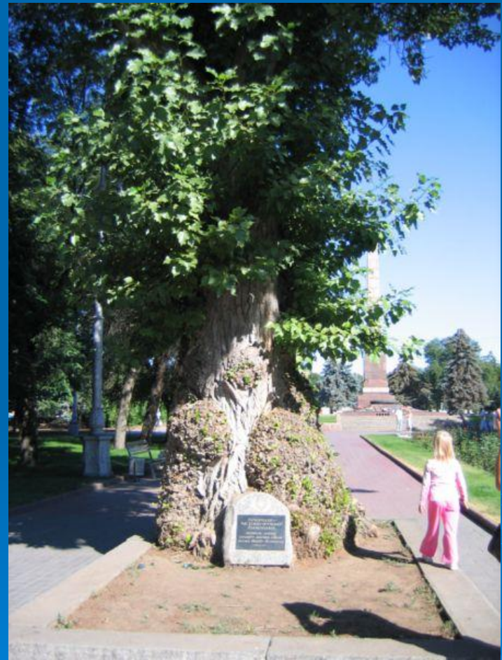
На фото: Тополь на Аллее Героев

Тополь на Аллее Героев — исторический и природный памятник Волгограда. Расположен в Центральном районе на Аллее Героев рядом с «Вечным огнём» и памятником Рубену Ибаррури. Тополь, выживший в центре Сталинградской битвы — живой свидетель истории. Имеет на своем стволе многочисленные свидетельства военных действий.