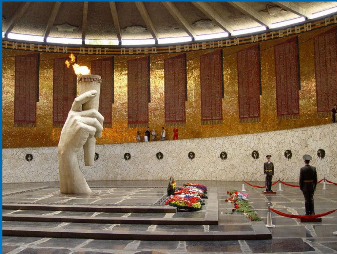
На фото: Вечный огонь

Мамáев кургáн расположен в Центральном районе города Волгограда, где во время Сталинградской битвы происходили ожесточённые бои (особенно в сентябре 1942 года и январе 1943) продолжительность ю 200 дней.