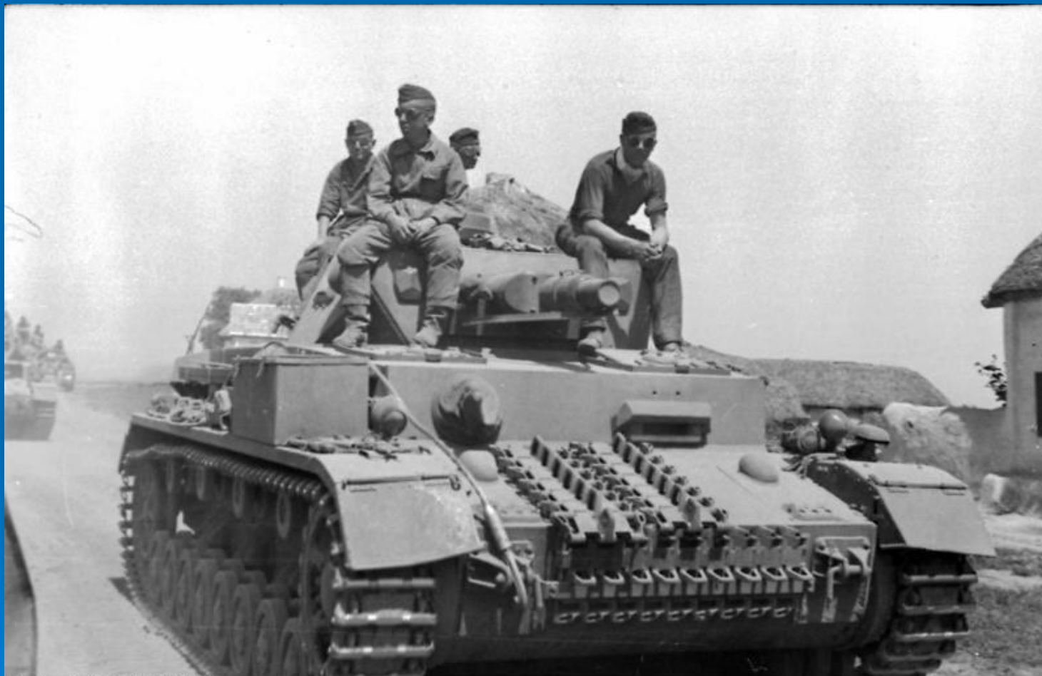
Juni 1942