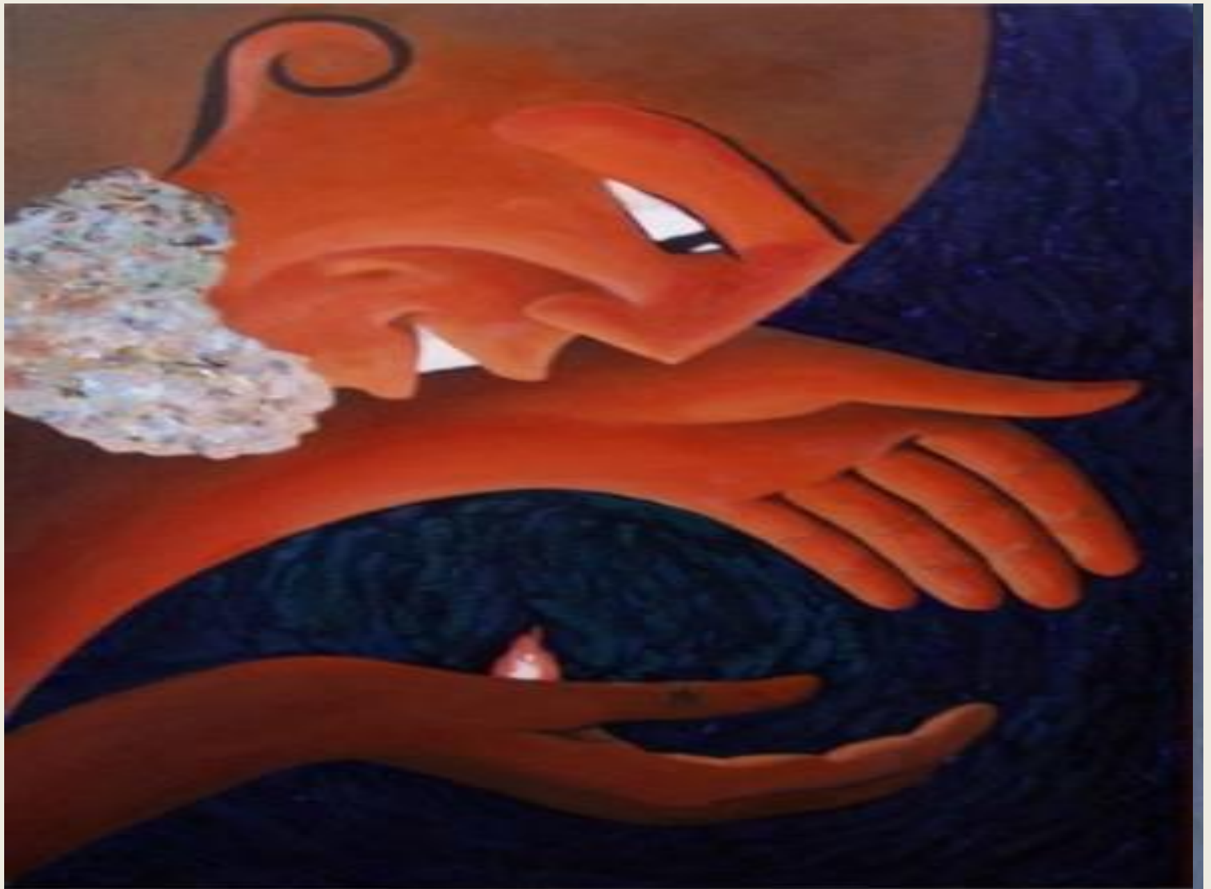
А. Кофанов "Прометей"