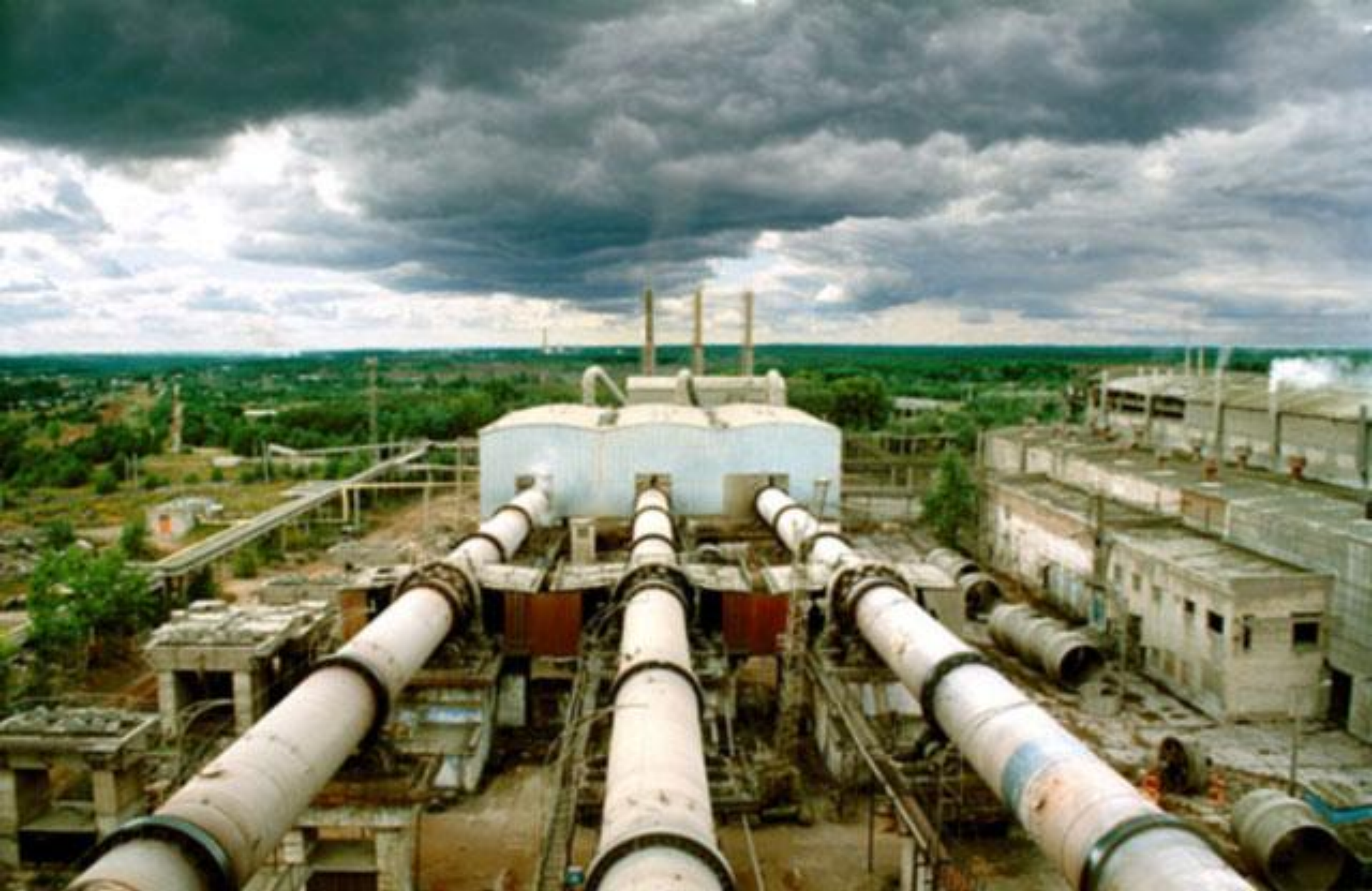
Цементный завод – источник опасной пыли.